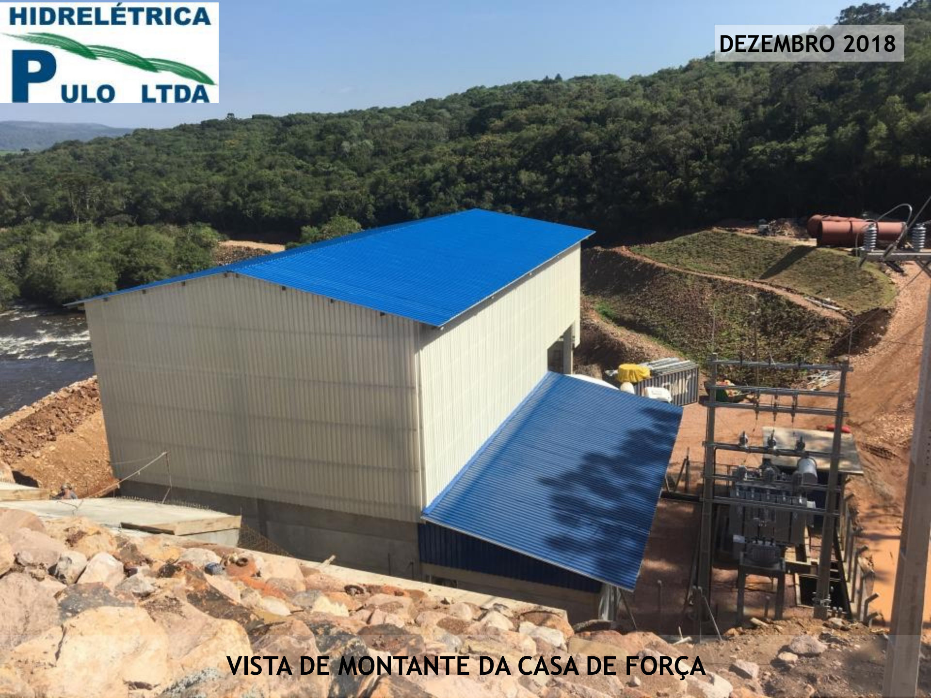
VISTA DE MONTANTE DA CASA DE FORÇA