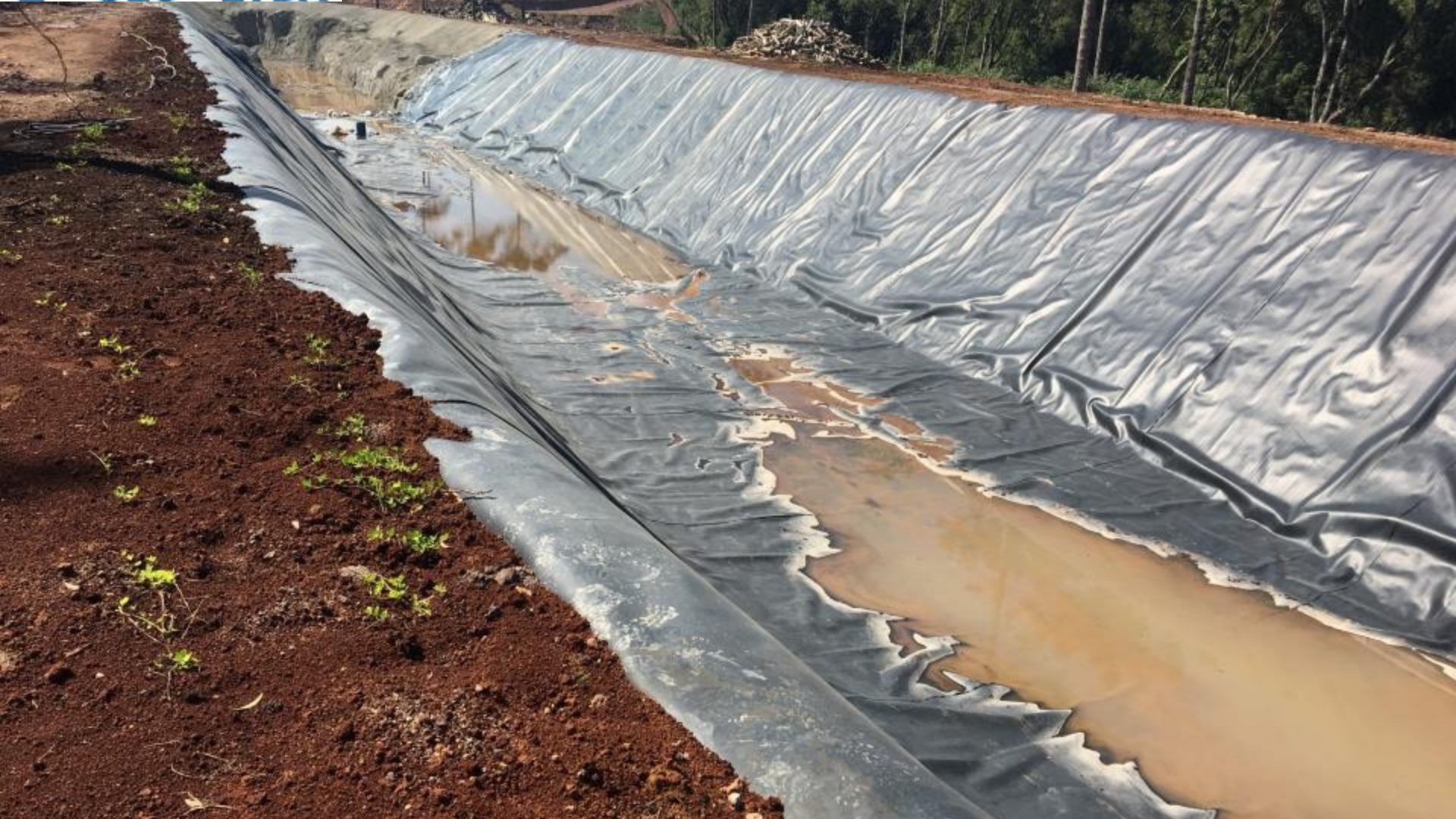
CANAL ADUTOR EXECUTADO PLANTIO DE GRAMA TIPO AMENDOIM NAS BORDAS DO CANAL