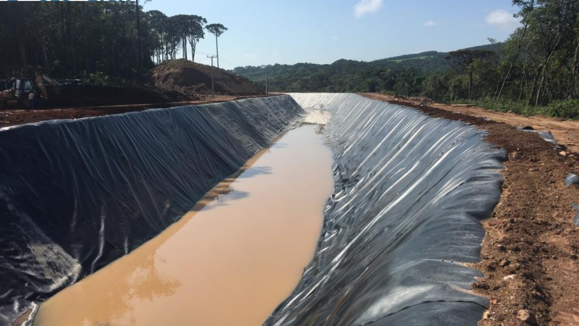
CANAL ADUTOR VISTA DO CANAL REVESTIDO ENTRE AS ESTACAS 30 A 40