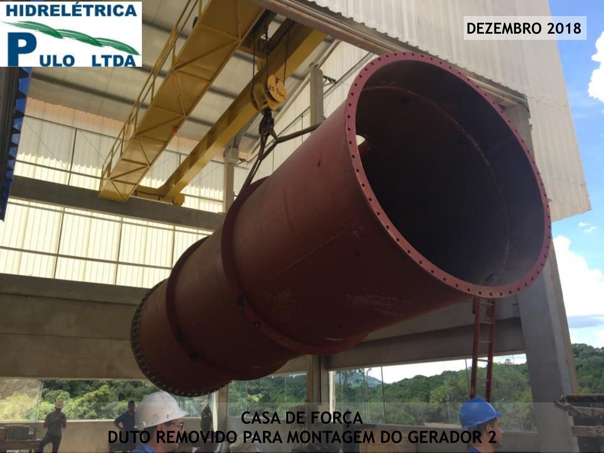
CASA DE FORÇA DUTO REMOVIDO PARA MONTAGEM DO GERADOR 2