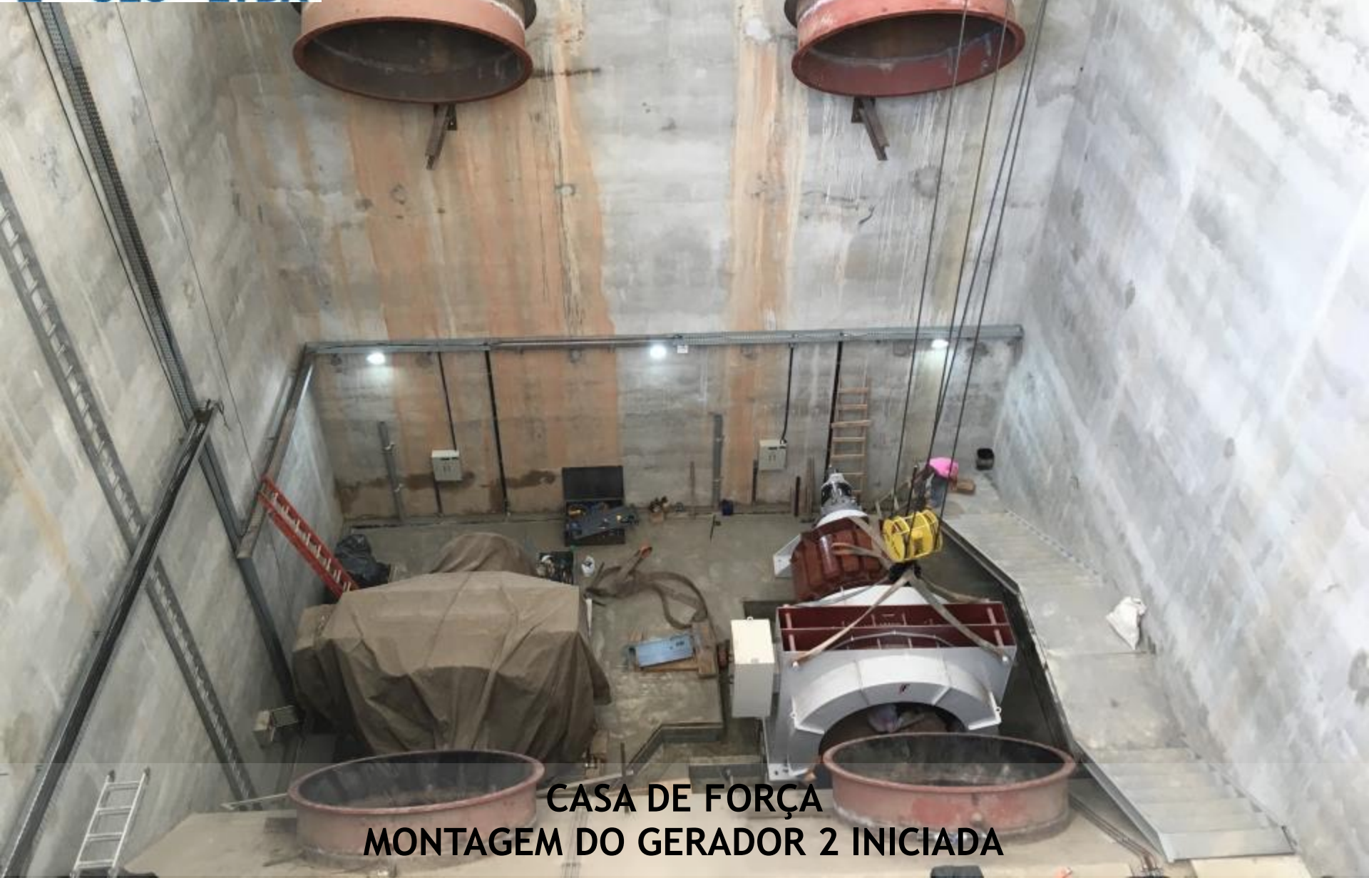
CASA DE FORÇA MONTAGEM DO GERADOR 2 INICIADA