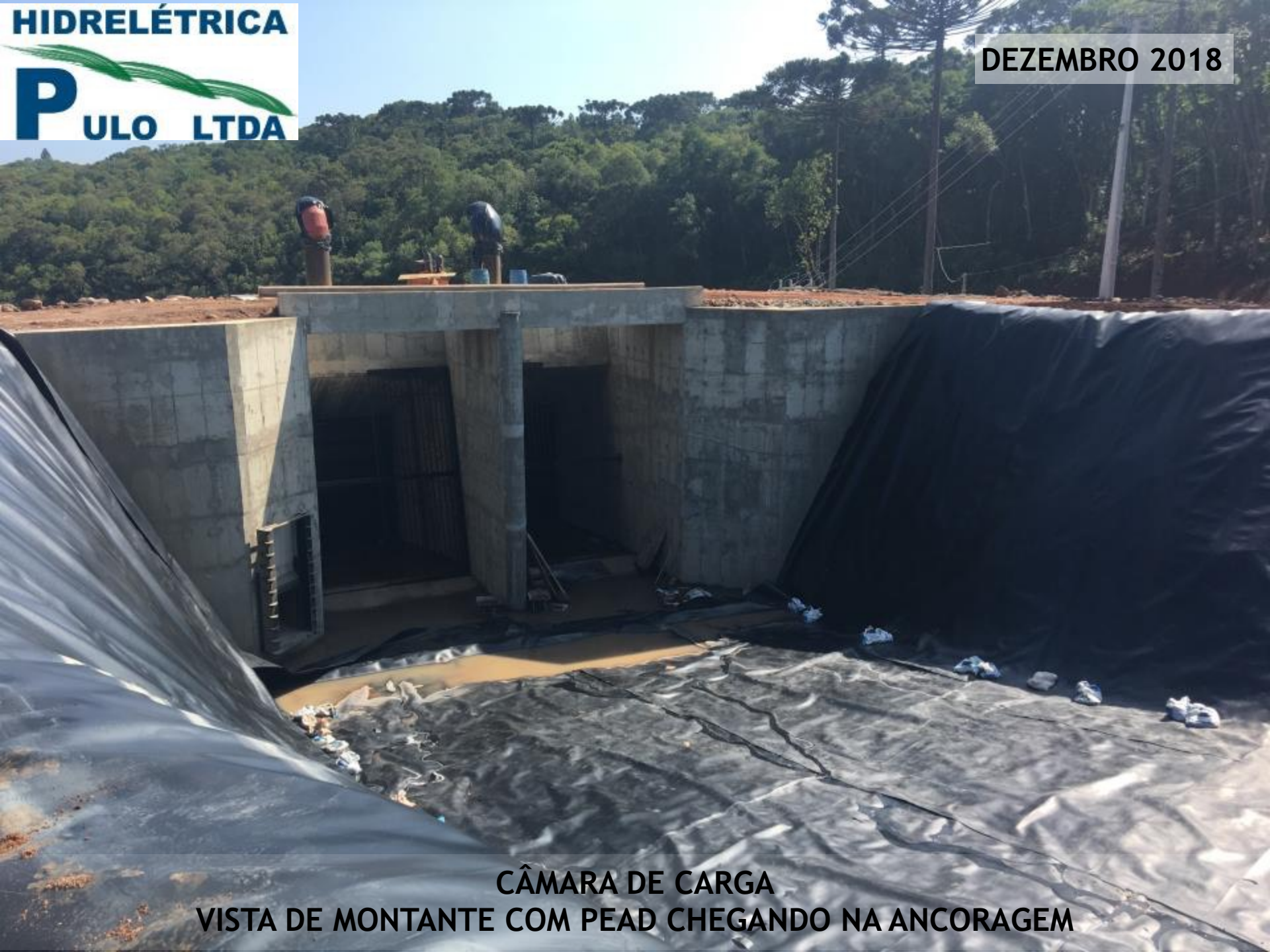
CÂMARA DE CARGA VISTA DE MONTANTE COM PEAD CHEGANDO NA ANCORAGEM