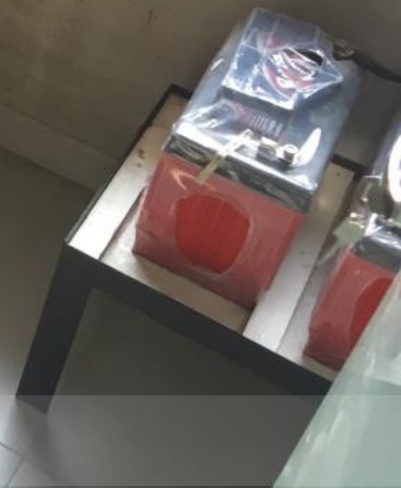
SALA DE COMANDO BANCO DE BATERIAS MONTADO