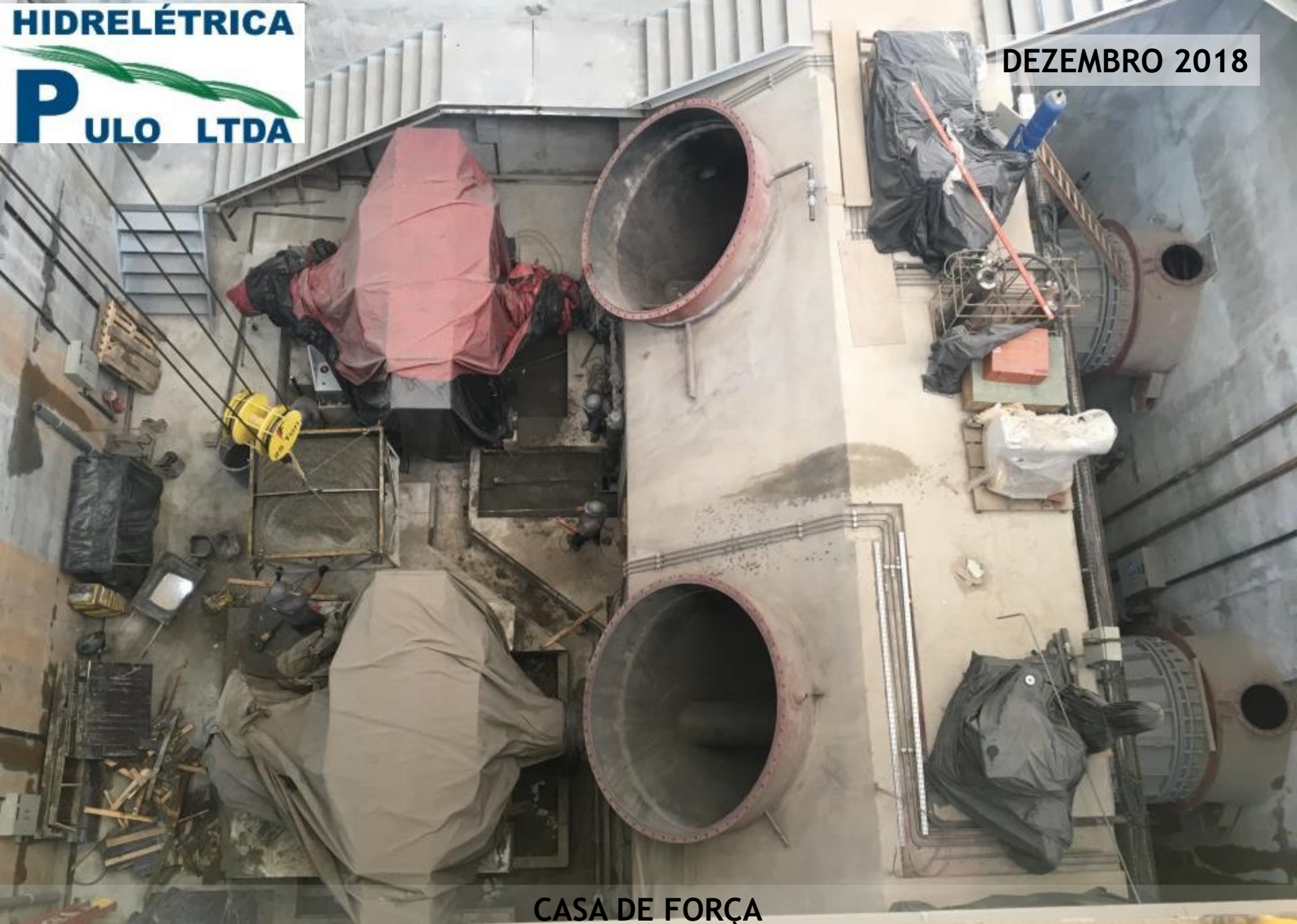
CASA DE FORÇA VISTA INTERNA DEZ/18 - MONTAGEM DOS GERADORES EM ANDAMENTO