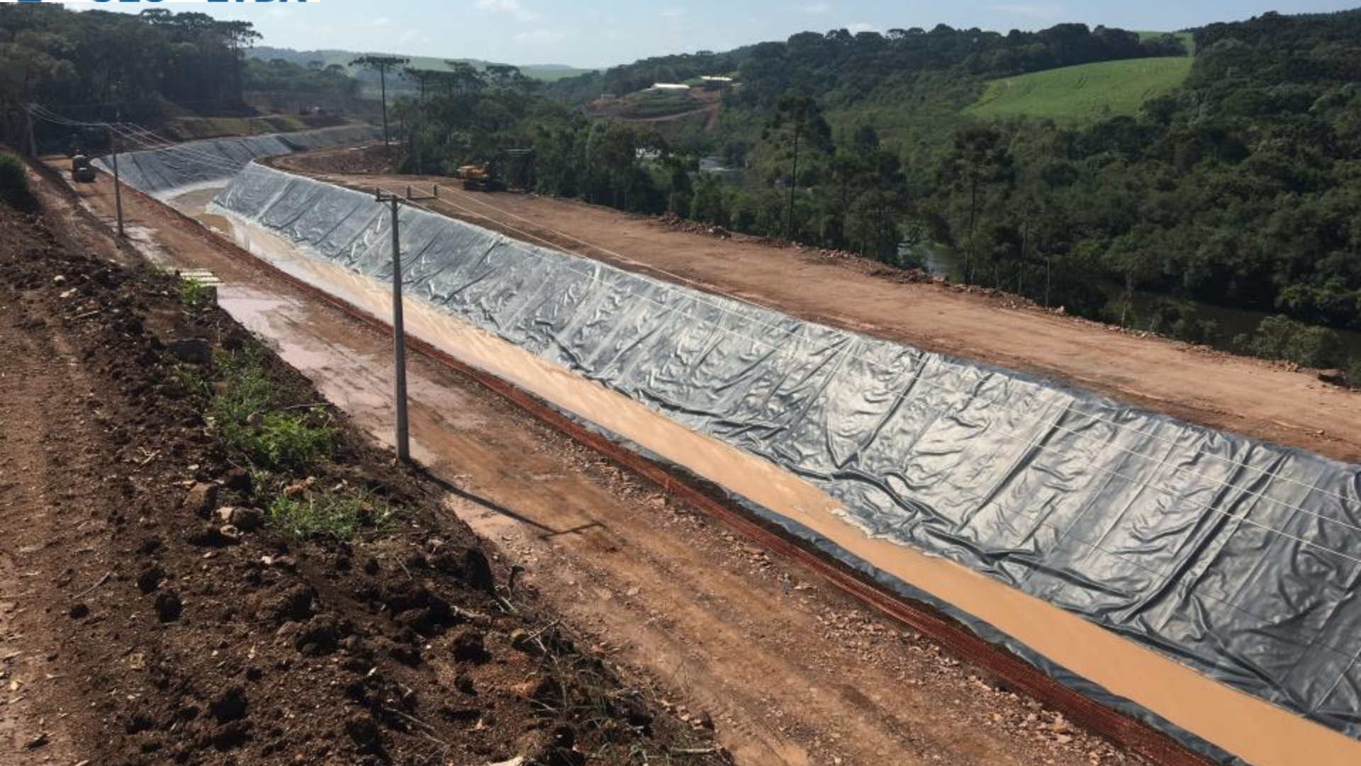
CANAL ADUTOR EXECUTADO CASCALHAMENTO DA ESTRADA LATERAL DO CANAL