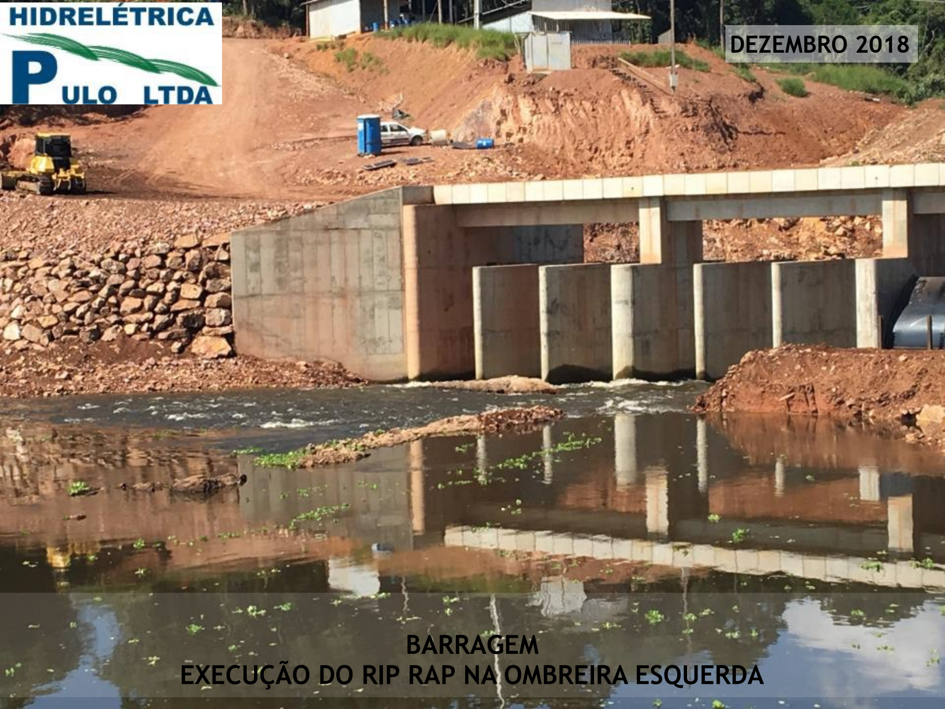
BARRAGEM EXECUÇÃO DO RIP RAP NA OMBREIRA ESQUERDA