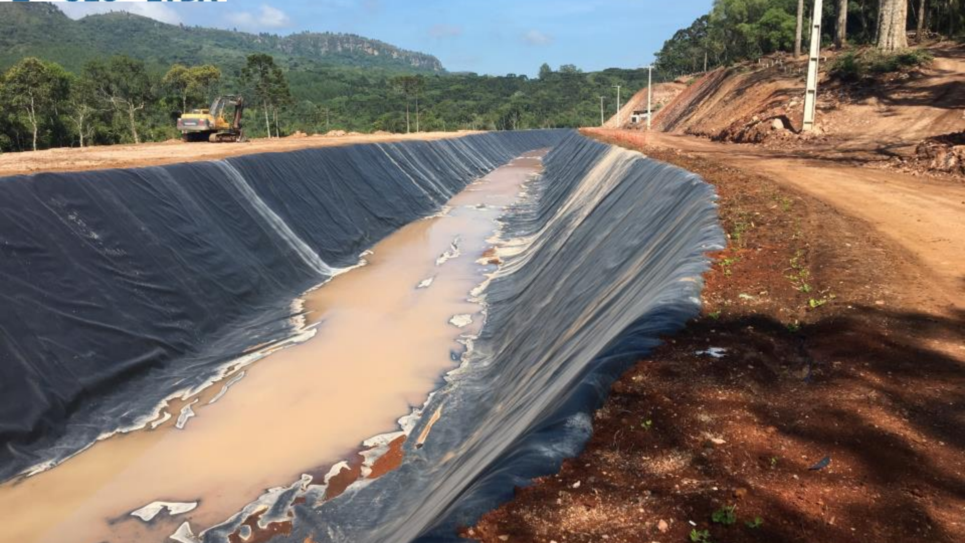
CANAL ADUTOR VISTA DO CANAL REVESTIDO ENTRE AS ESTACAS 10 A 20