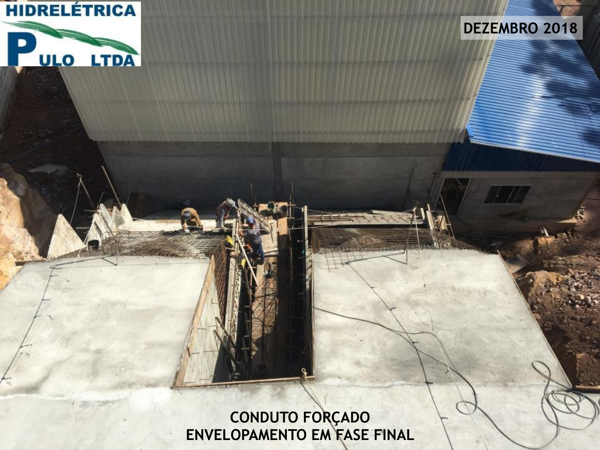
CONDUTO FORÇADO ENVELOPAMENTO EM FASE FINAL