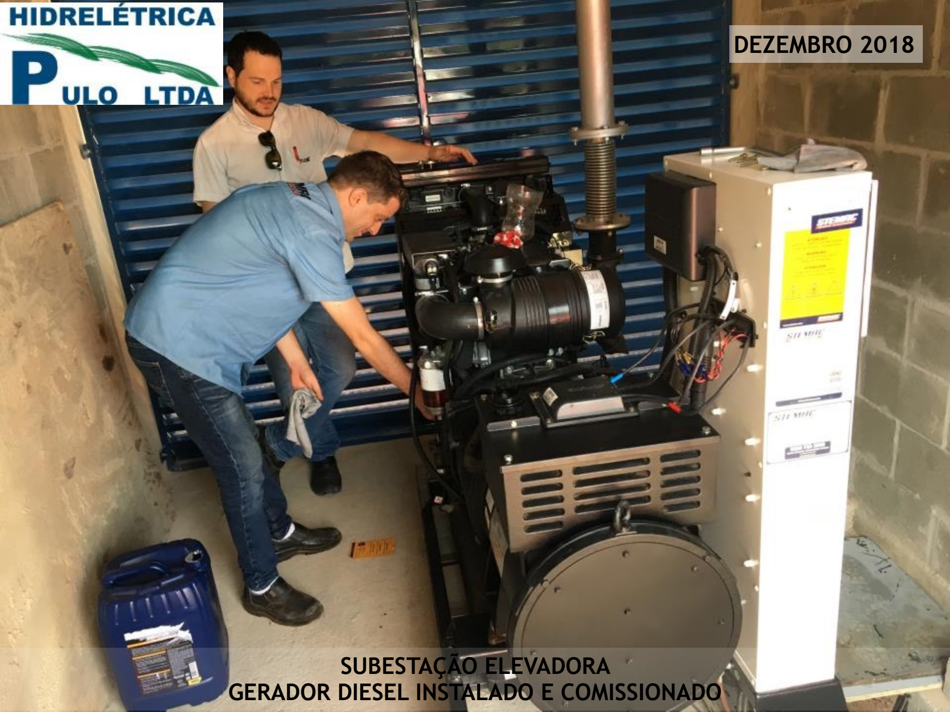
SUBESTAÇÃO ELEVADORA GERADOR DIESEL INSTALADO E COMISSIONADO