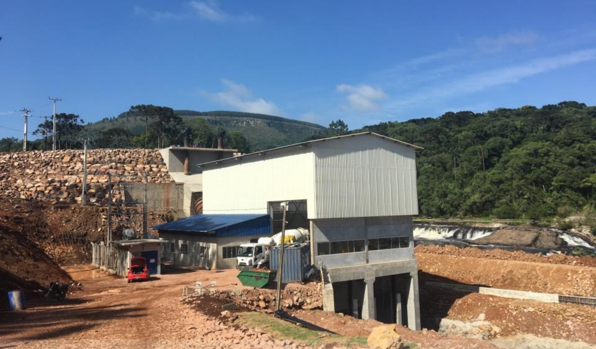
VITA DE JUSANTE DA CASA DE FORÇA