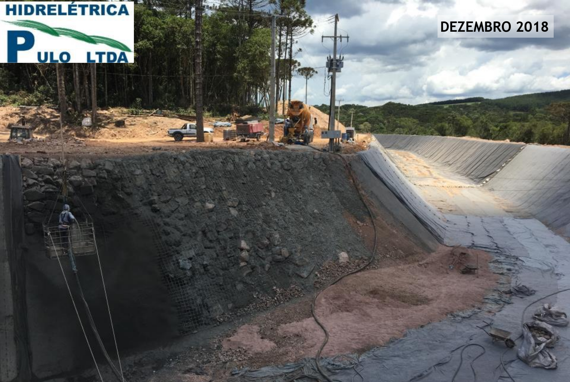
CANAL ADUTOR EXECUTADA RECOMPOSIÇÃO COM ENROCAMENTO E CONCRETO PROJETADO NA LATERAL DIREITA DA CHEGADA NA CÂMARA DE CARGA