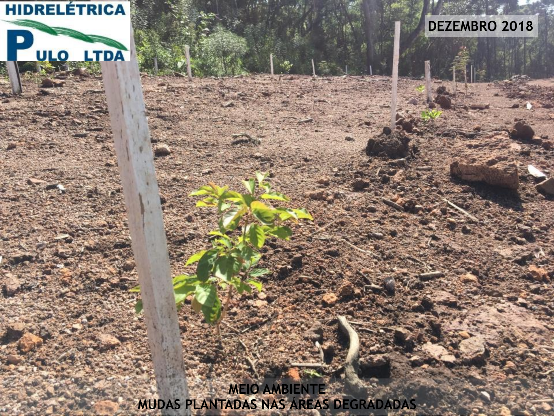
MEIO AMBIENTE MUDAS PLANTADAS NAS ÁREAS DEGRADADAS