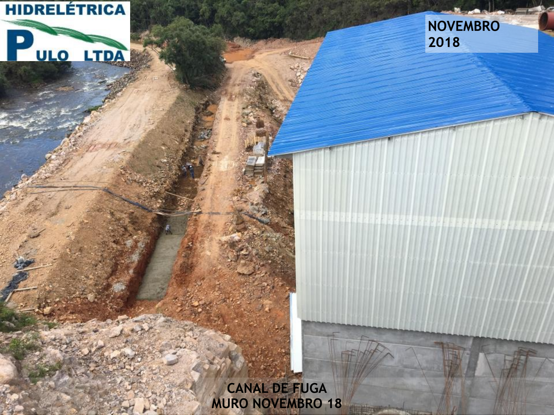
CANAL DE FUGA MURO NOVEMBRO 18