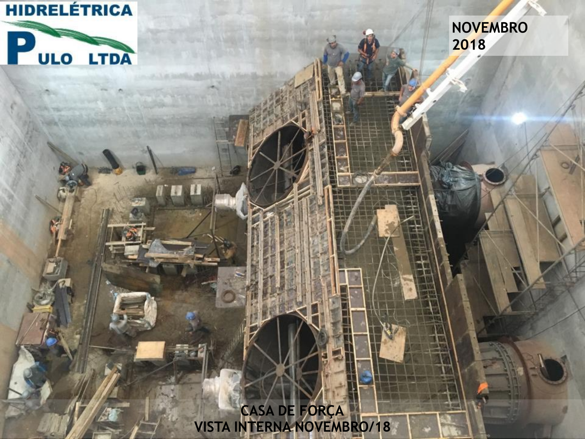
CASA DE FORÇA VISTA INTERNA NOVEMBRO/18