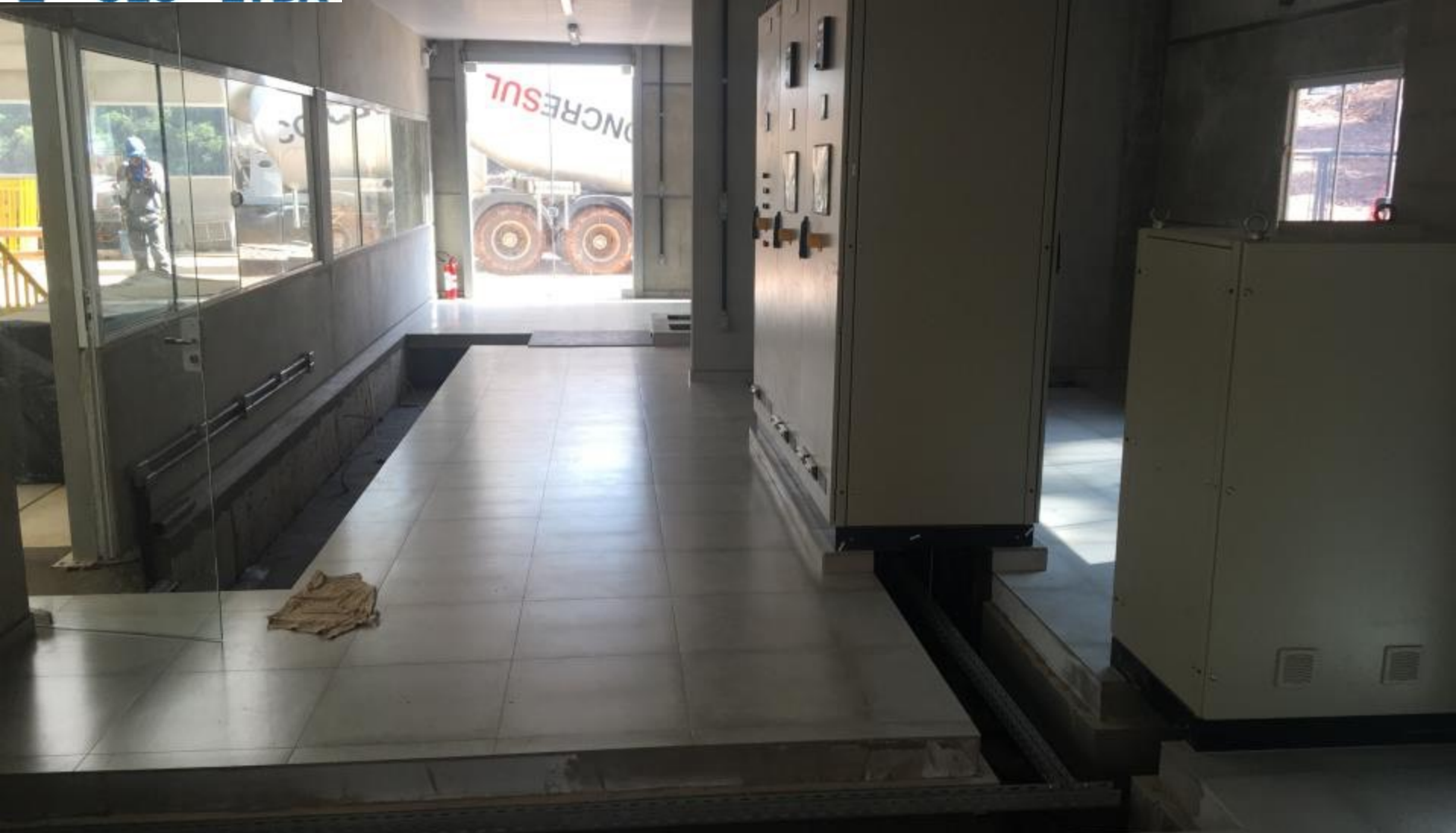
SALA DE COMANDO OBRAS CIVIS E MONTAGENS ELÉTRICAS DOS PAINÉIS FINALIZADAS