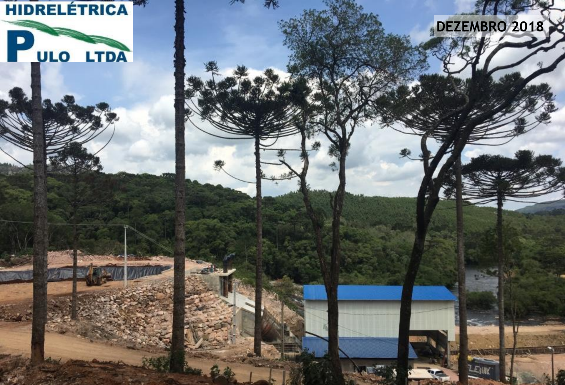
VISTA LATERAL DA CASA DE FORÇA