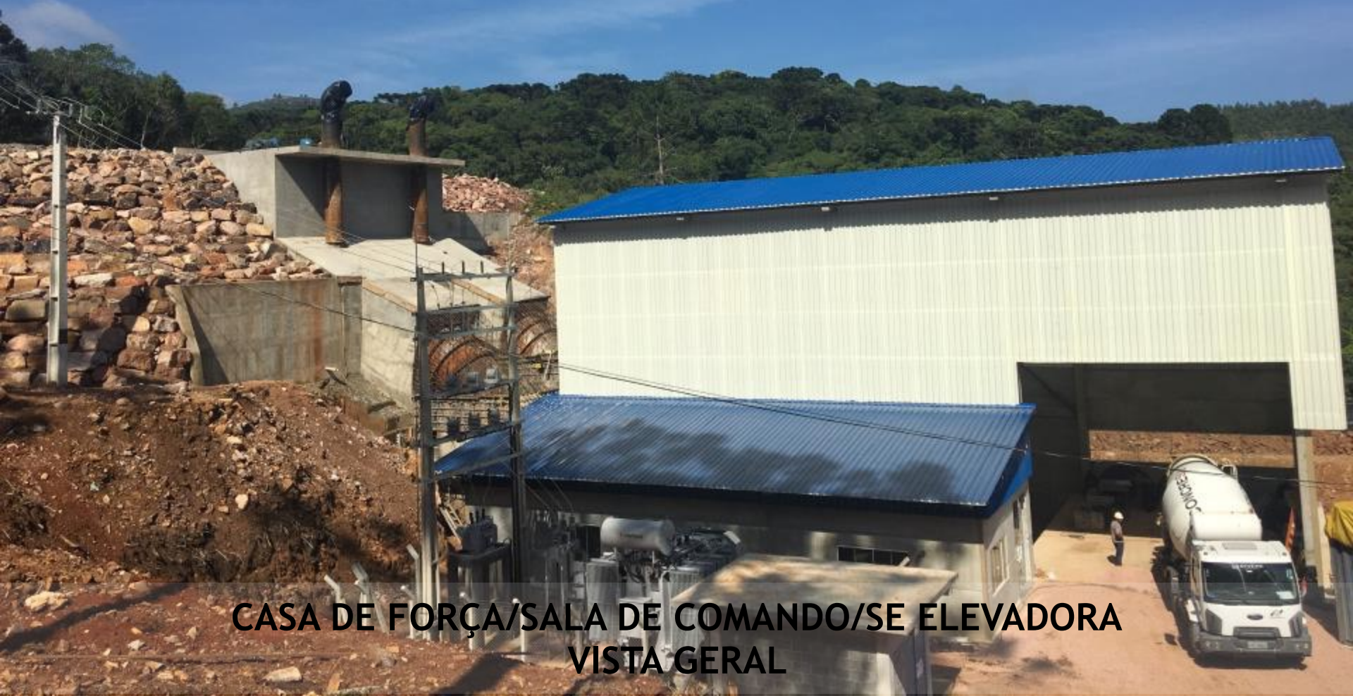
CASA DE FORÇA/SALA DE COMANDO/SE ELEVADORA VISTA GERAL