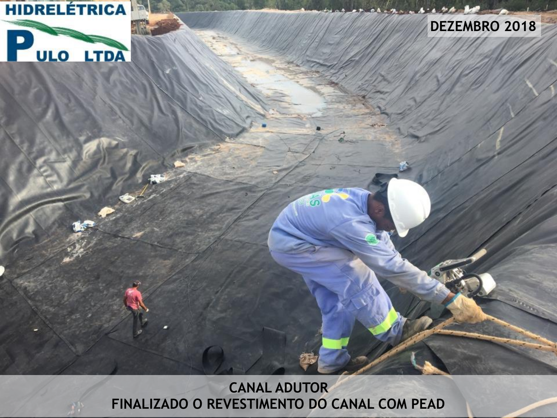
CANAL ADUTOR FINALIZADO O REVESTIMENTO DO CANAL COM PEAD