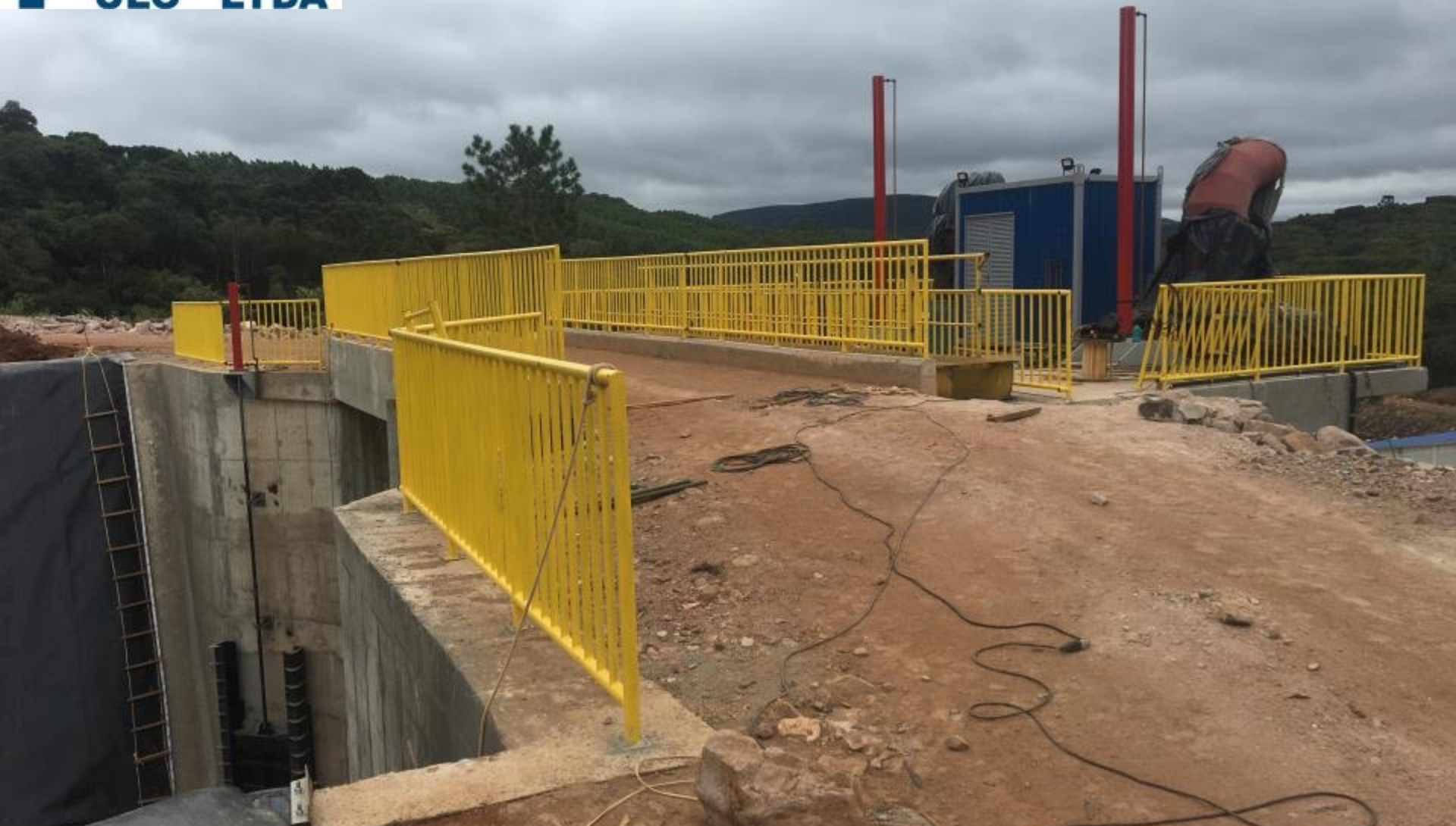
CÂMARA DE CARGA COM O ABRIGO DA UH E PISTÕES HIDRÁULICOS EM FUNCIONAMENTO