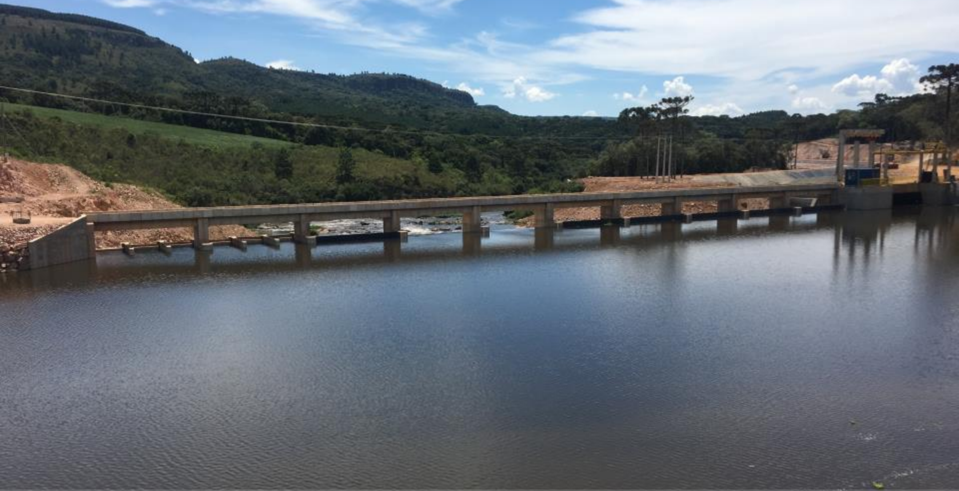
BARRAGEM VISTA DE MONTANTE DURANTE ENCHIMENTO DO LAGO