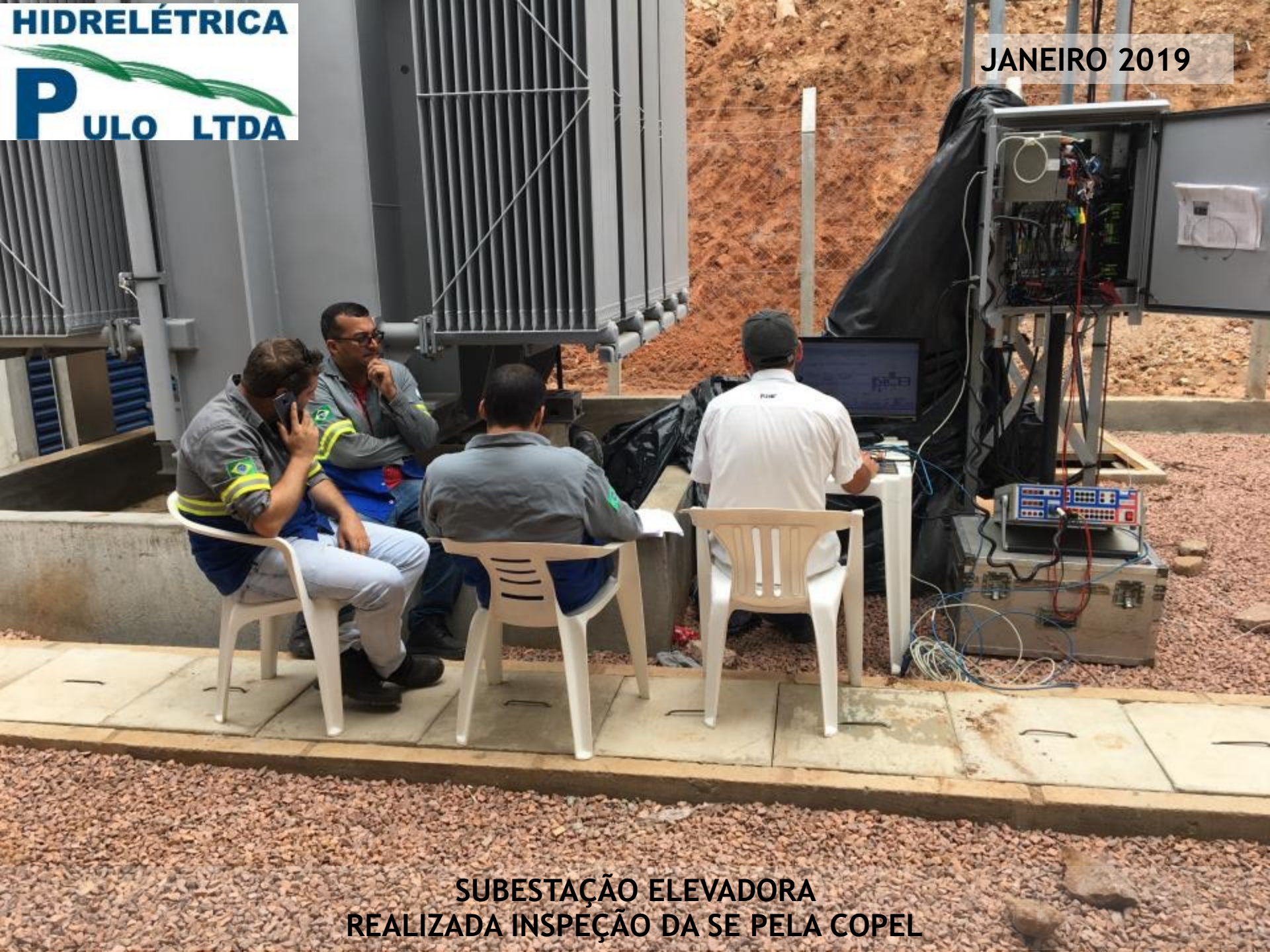
SUBESTAÇÃO ELEVADORA REALIZADA INSPEÇÃO DA SE PELA COPEL