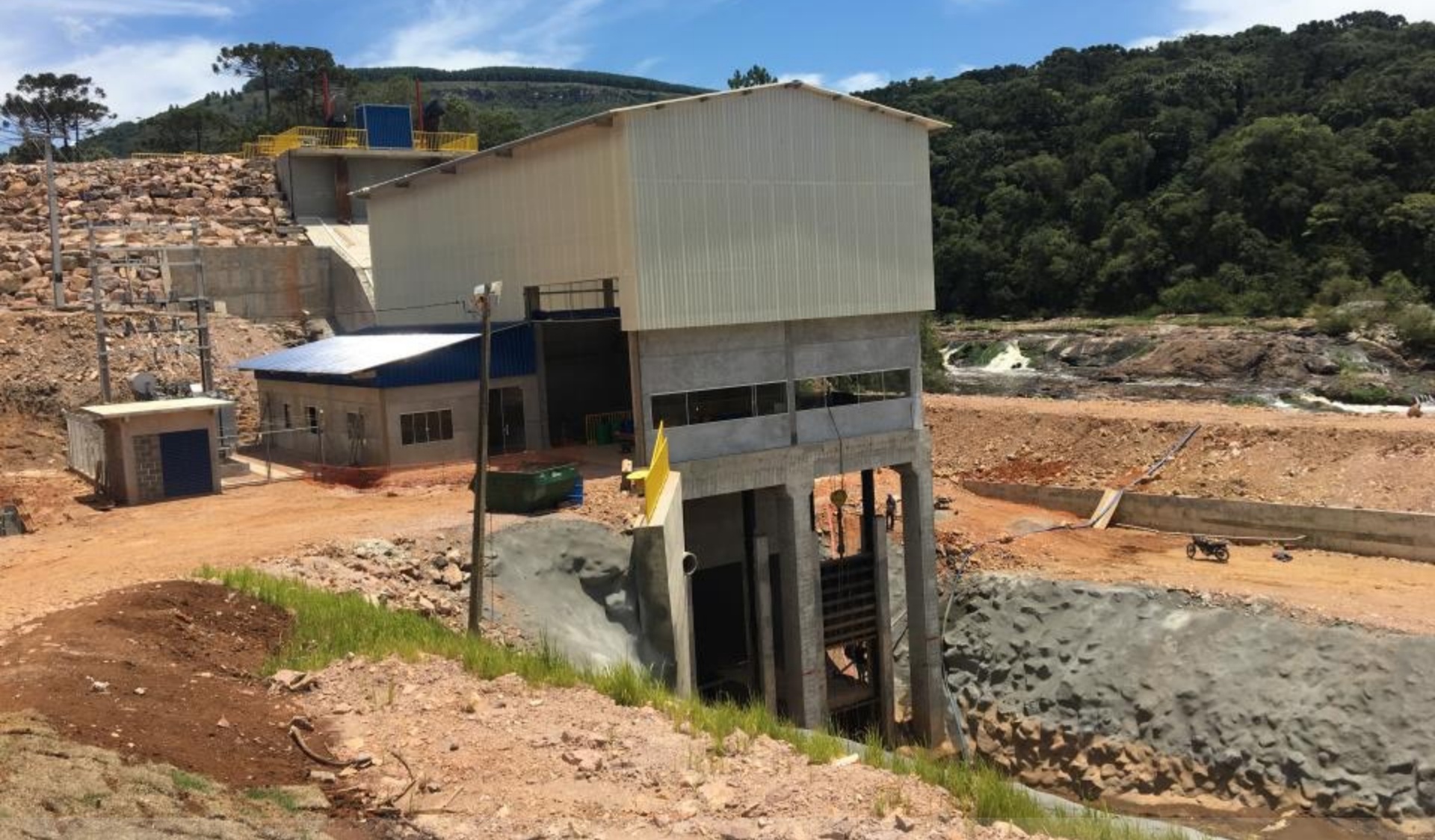
VITA DE JUSANTE DA CASA DE FORÇA