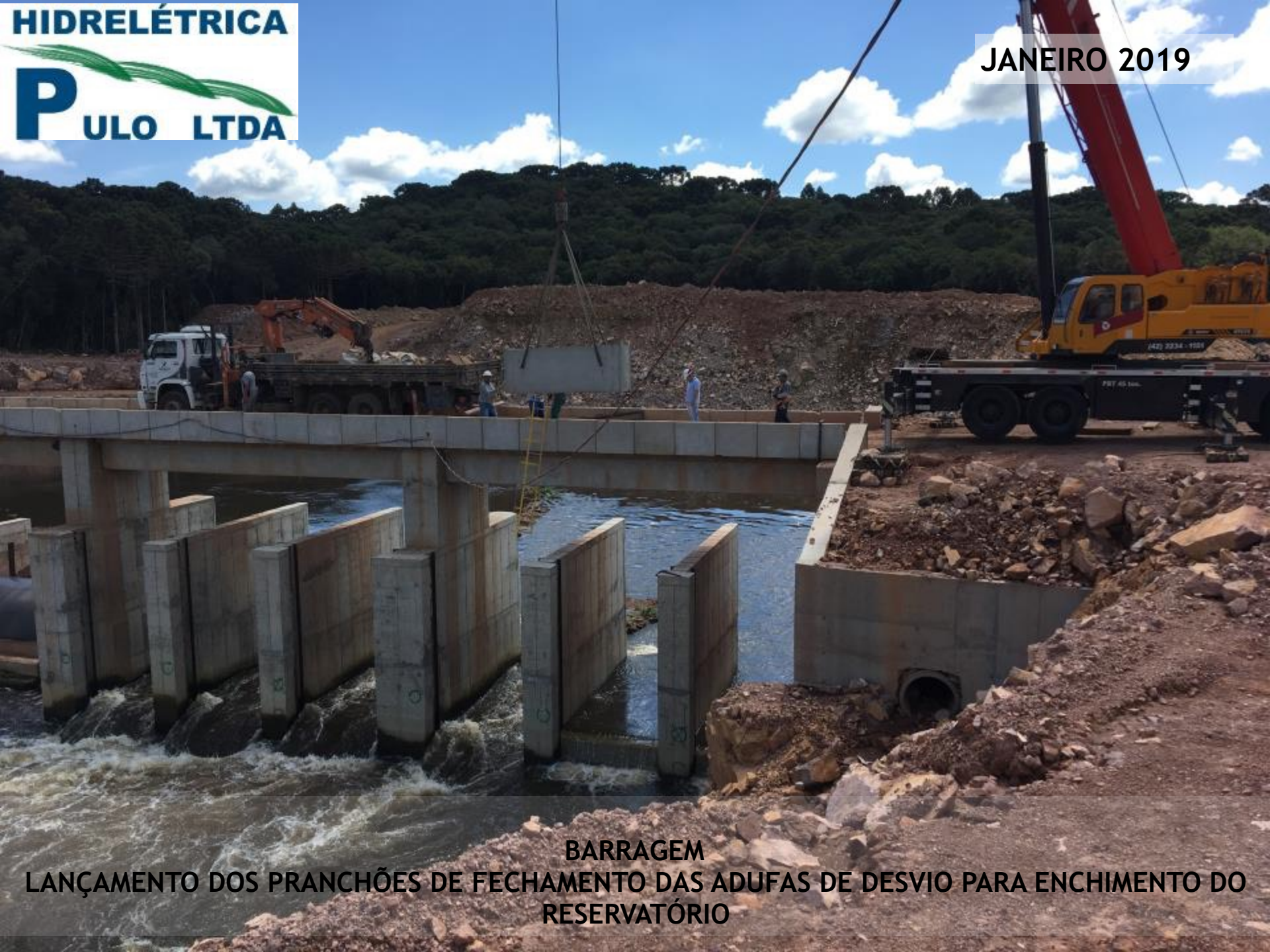
BARRAGEM LANÇAMENTO DOS PRANCHÕES DE FECHAMENTO DAS ADUFAS DE DESVIO PARA ENCHIMENTO DO RESERVATÓRIO