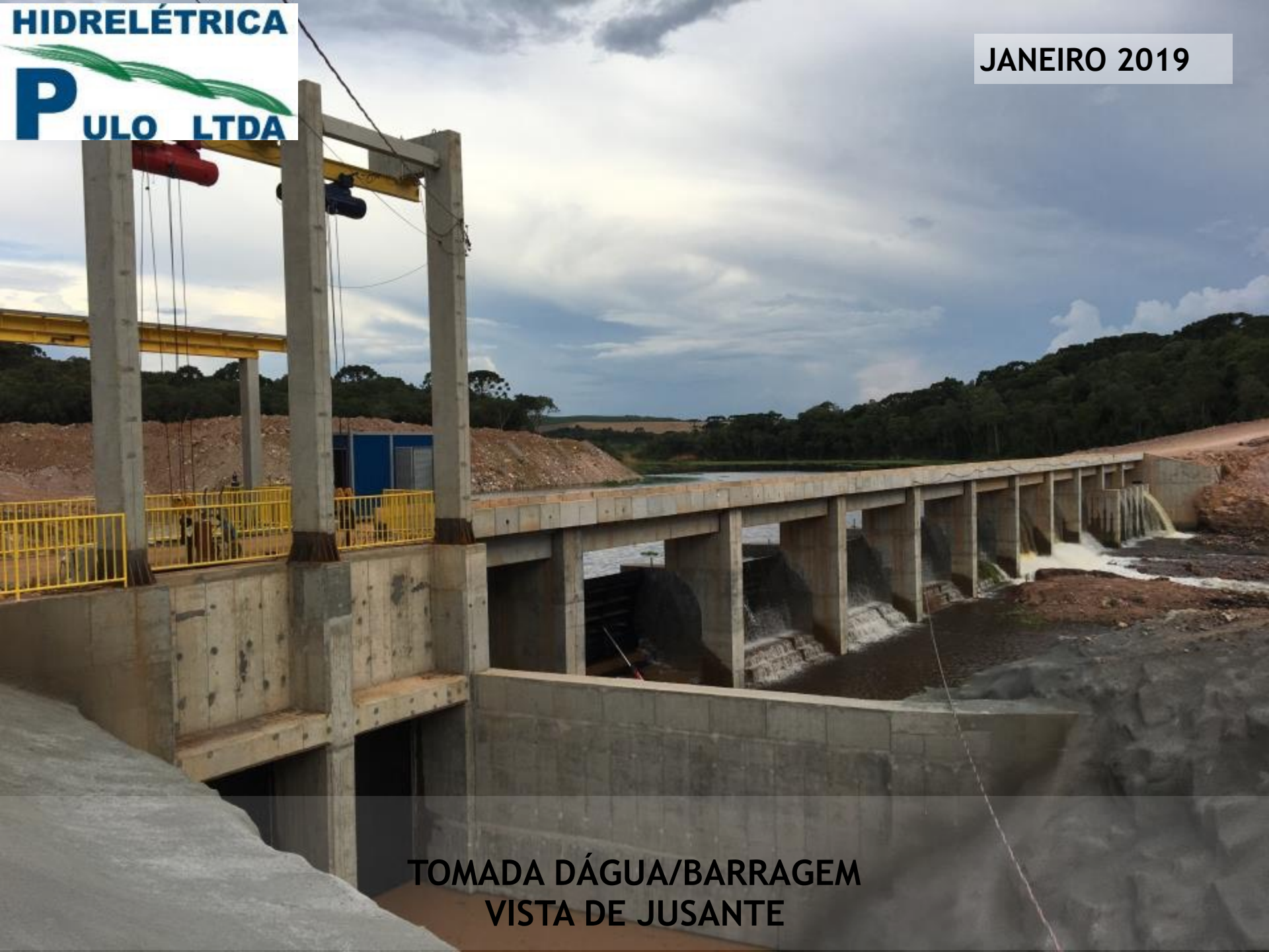
TOMADA D'ÁGUA/BARRAGEM VISTA DE JUSANTE