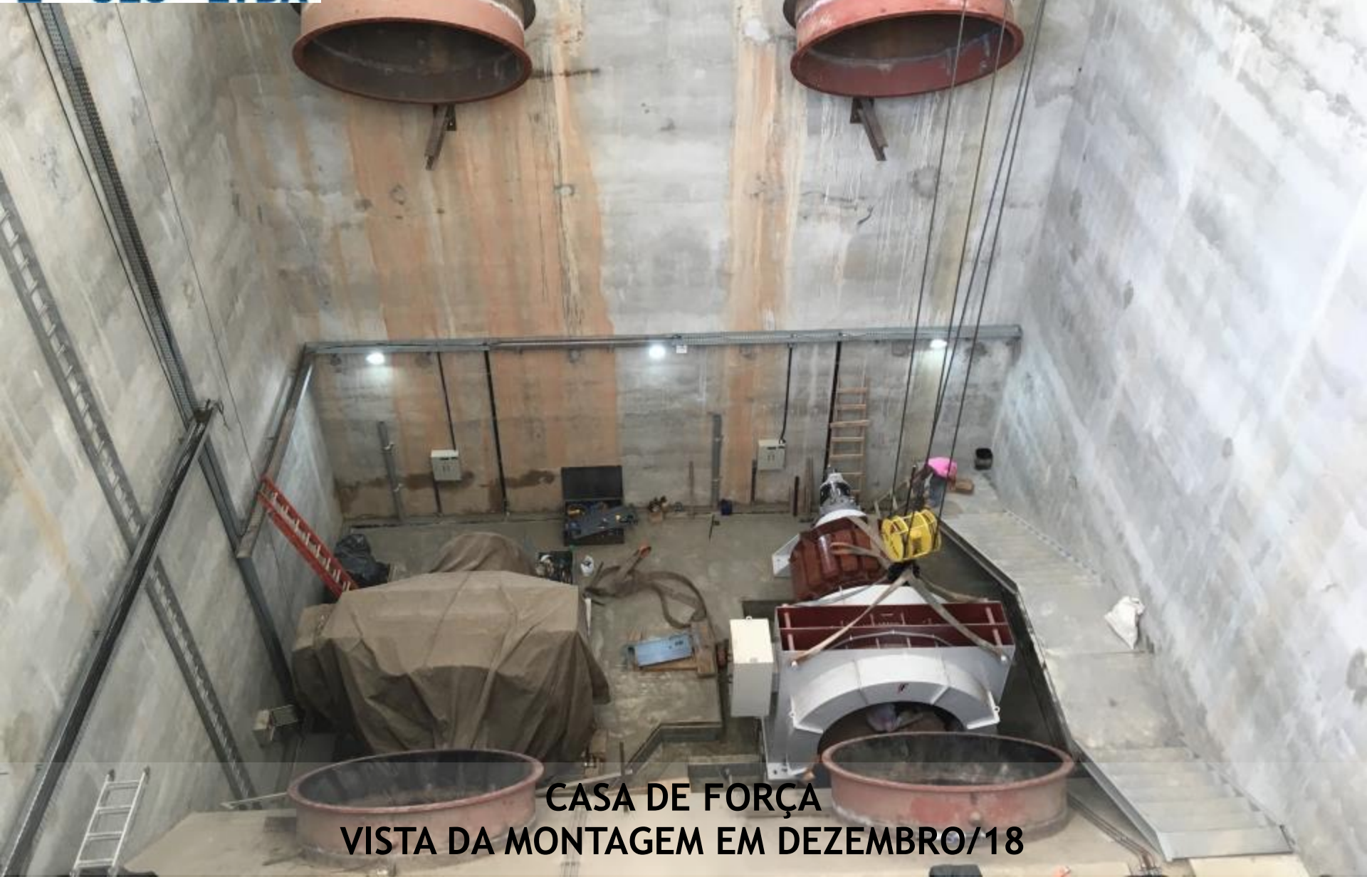
CASA DE FORÇA VISTA DA MONTAGEM EM DEZEMBRO/18