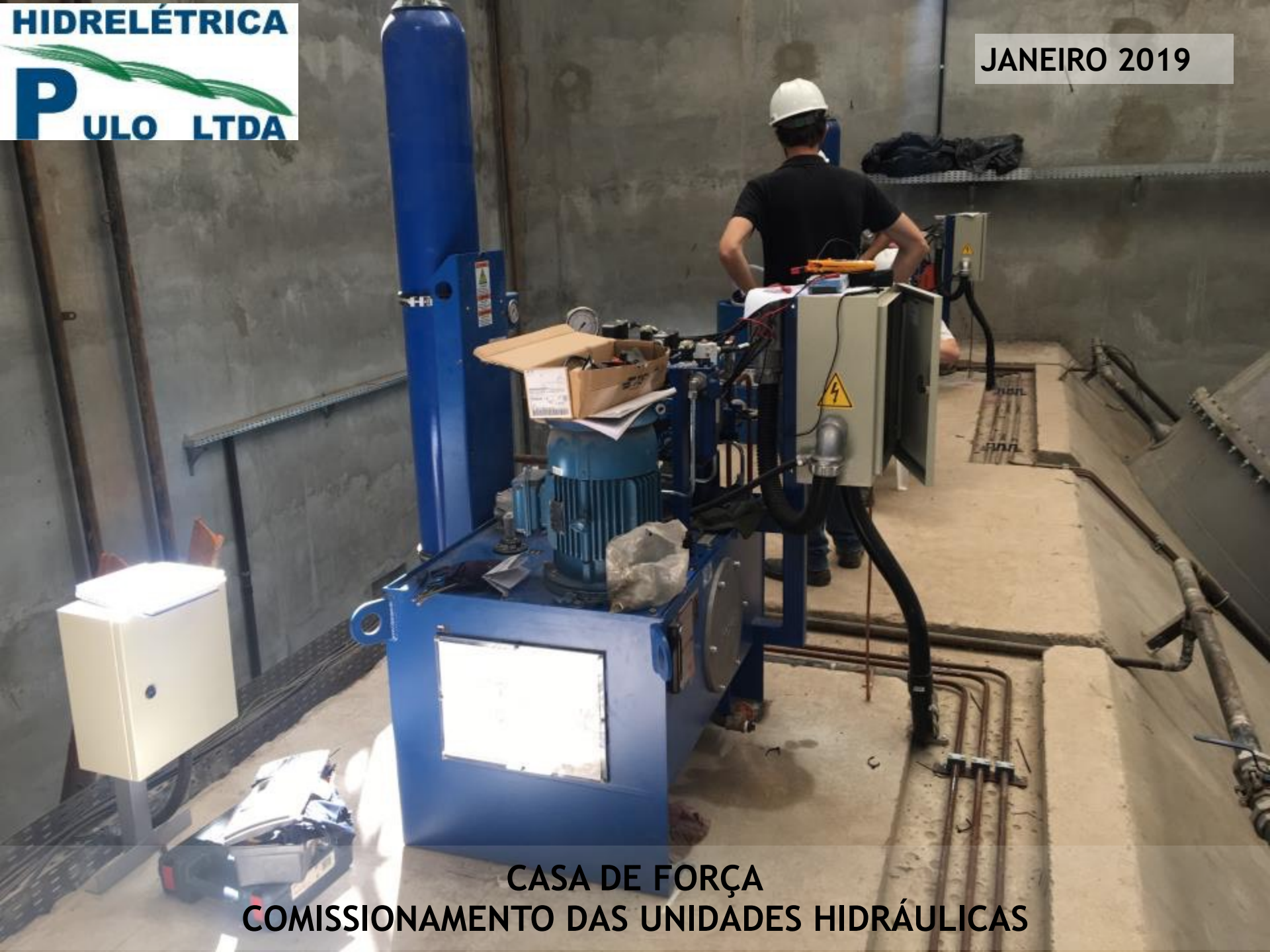
CASA DE FORÇA COMISSONAMENTO DAS UNIDADES HIDRÁULICAS