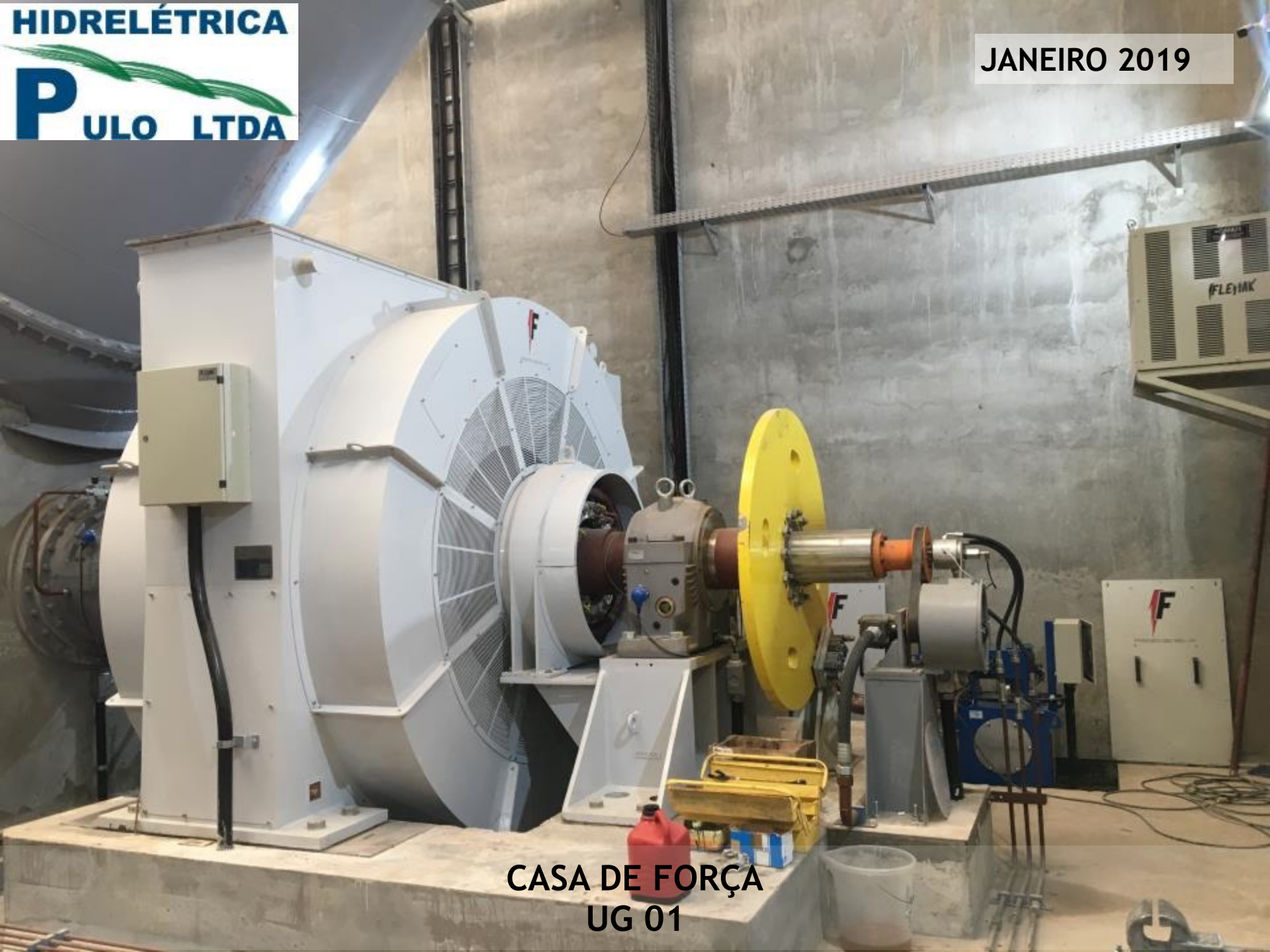
CASA DE FORÇA UG 01