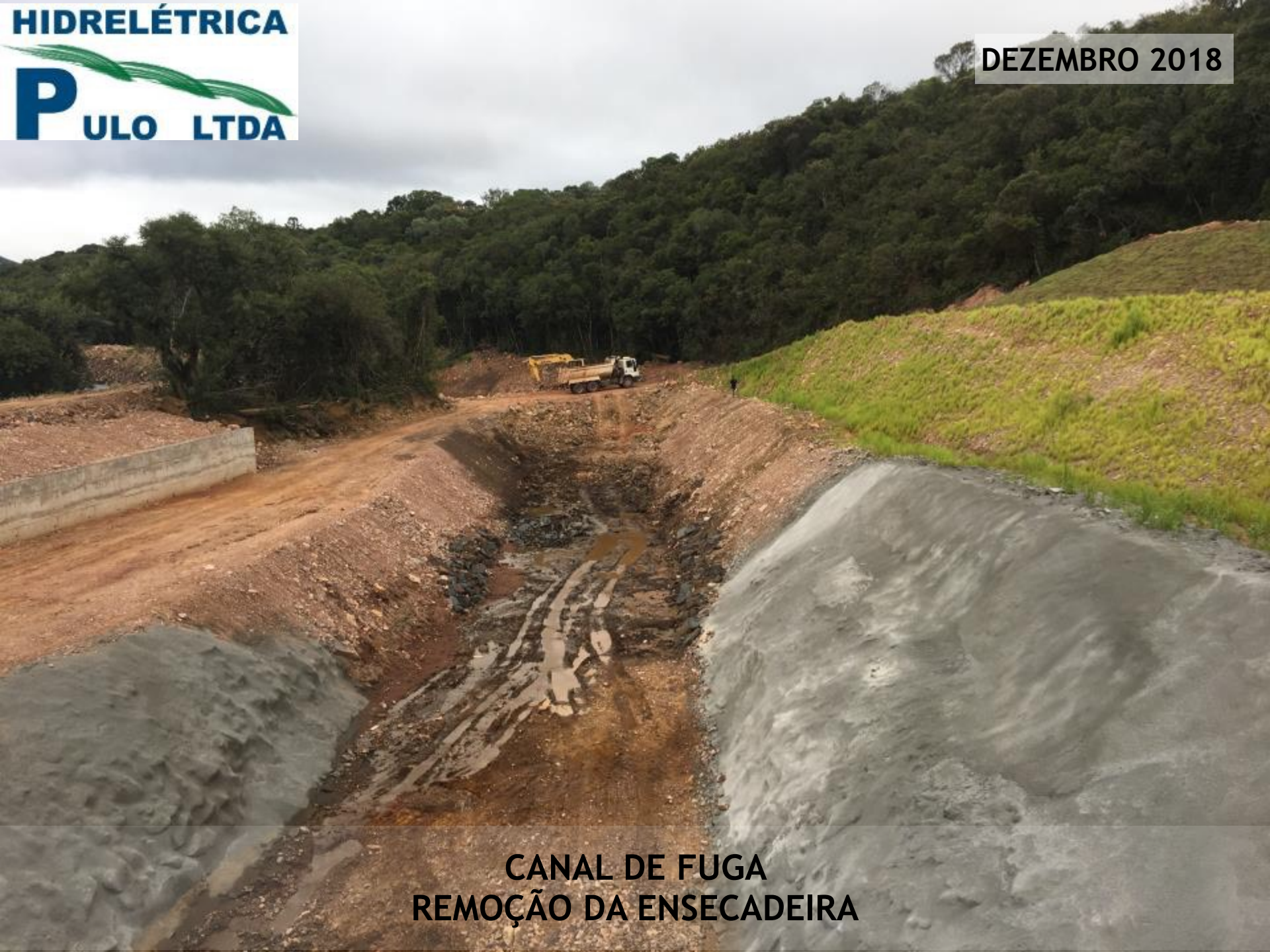
CANAL DE FUGA REMOÇÃO DA ENSECADDEIRA