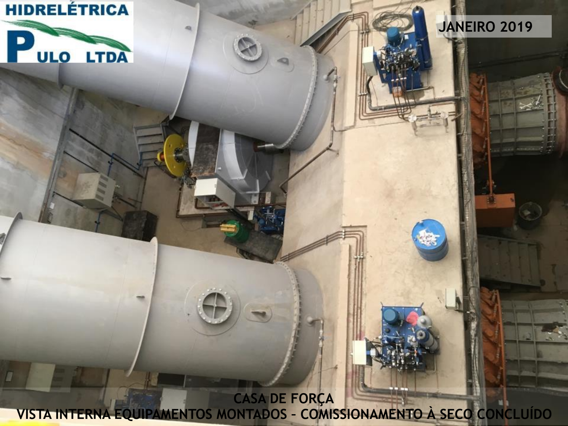
CASA DE FORÇA VISTA INTERNA EQUIPAMENTOS MONTADOS - COMISSONAMENTO À SECO CONCLUÍDO