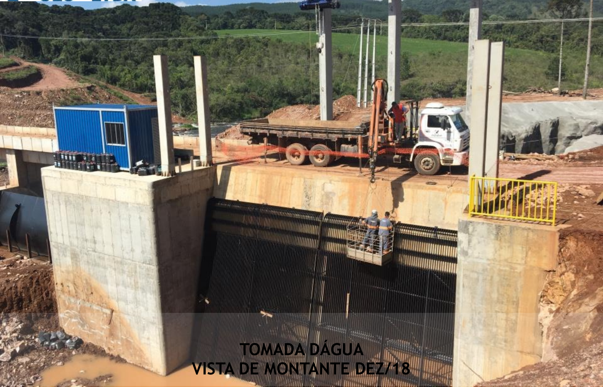
TOMADA D'ÁGUA VISTA DE MONTANTE DEZ/18