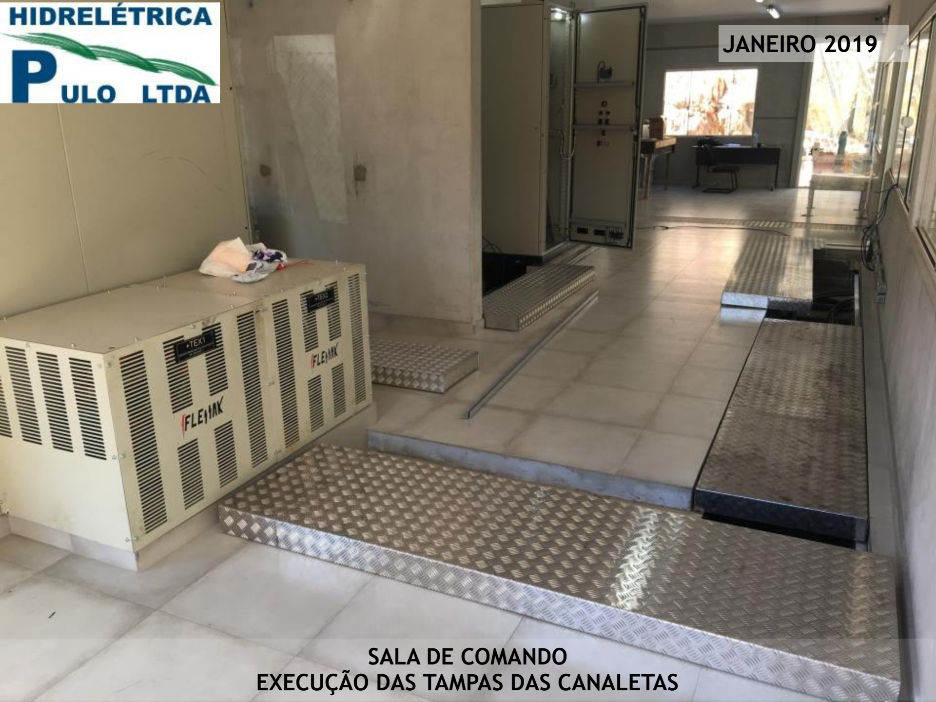
SALA DE COMANDO EXECUÇÃO DAS TAMPAS DAS CANALETAS