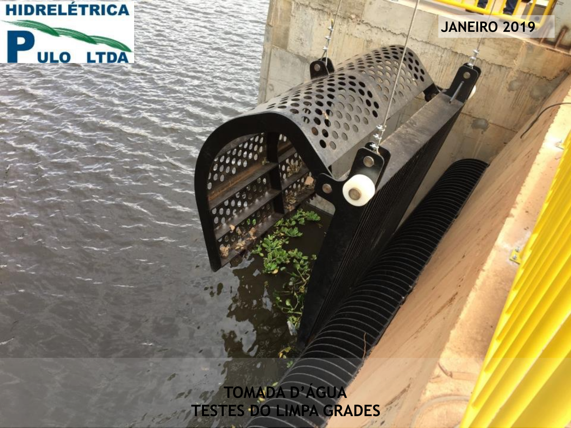
TOMADA D'ÁGUA TESTES DO LIMPA GRADES