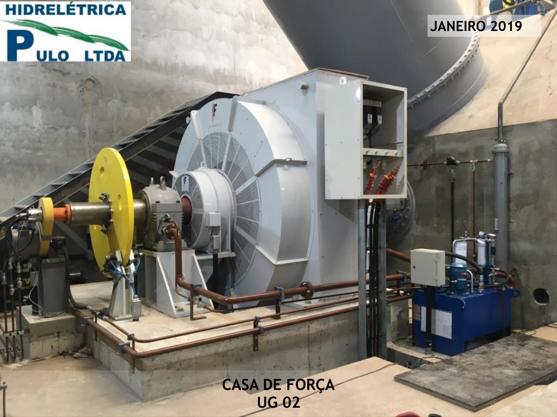
CASA DE FORÇA UG 02