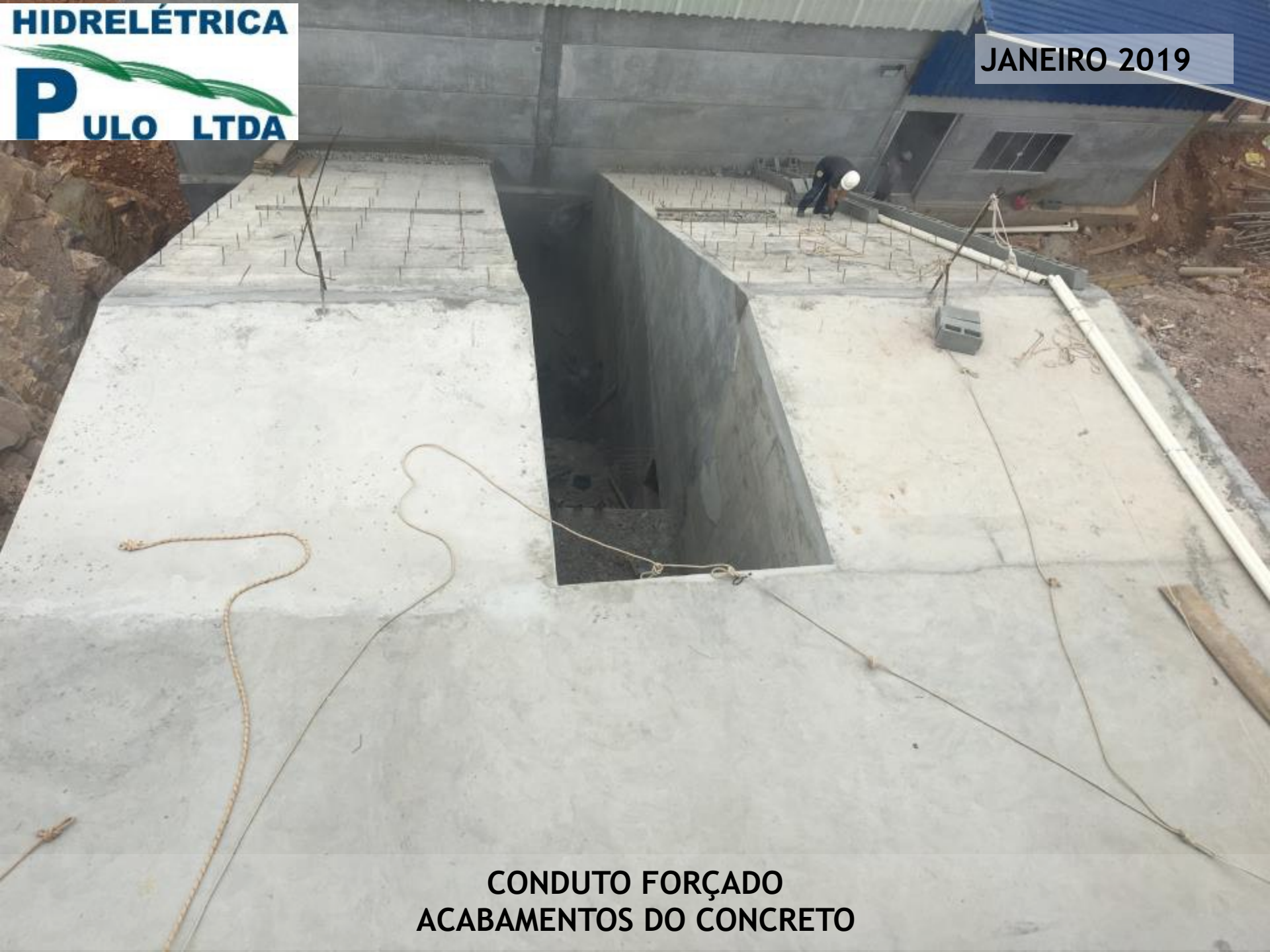
CONDUTO FORÇADO ACABAMENTOS DO CONCRETO