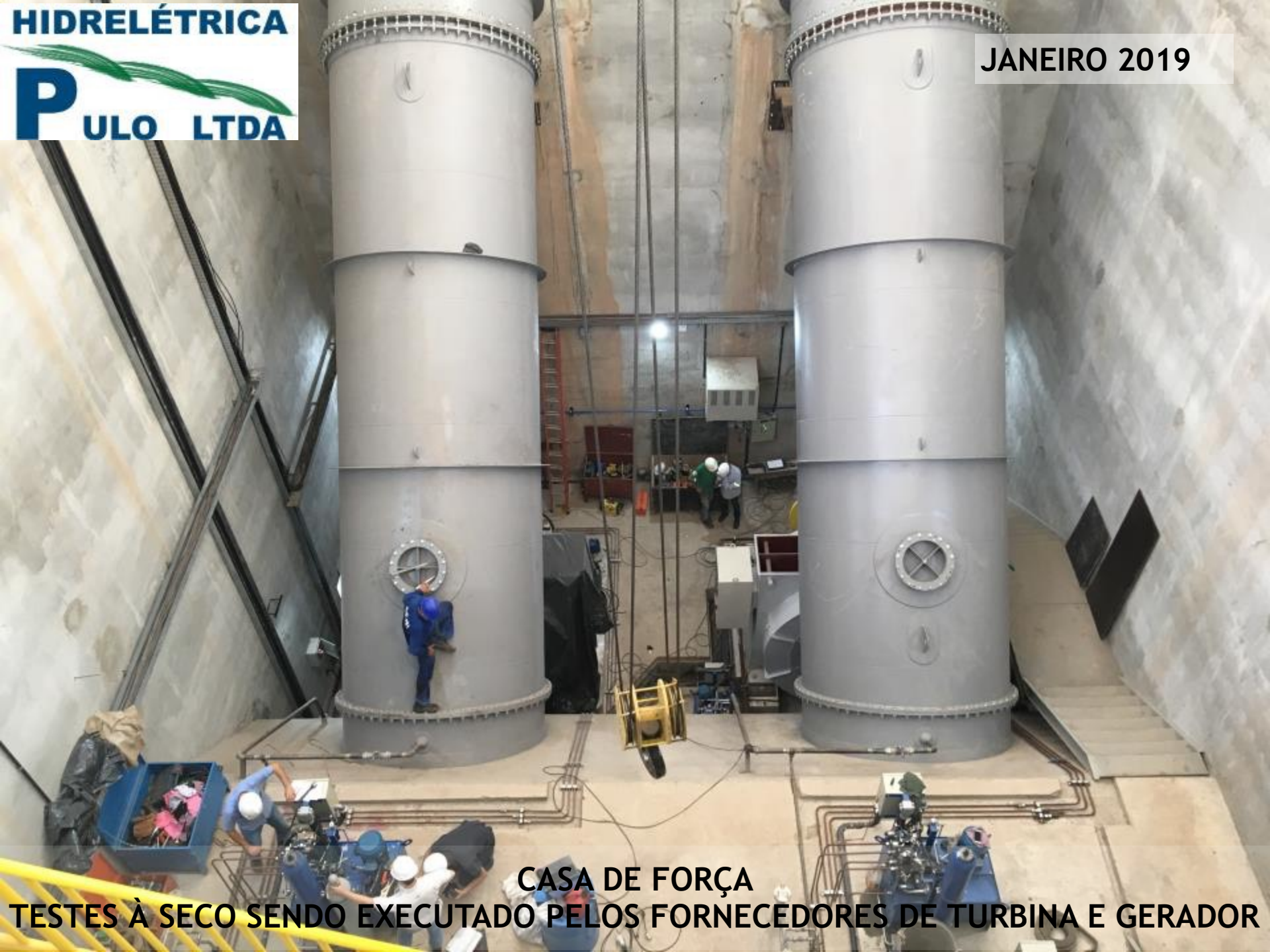
CASA DE FORÇA TESTES À SECO SENDO EXECUTADO PELOS FORNECEDORES DE TURBINA E GERADOR