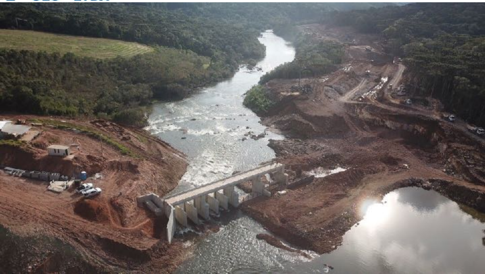
BARRAGEM VISTA DO RIO DESVIADO