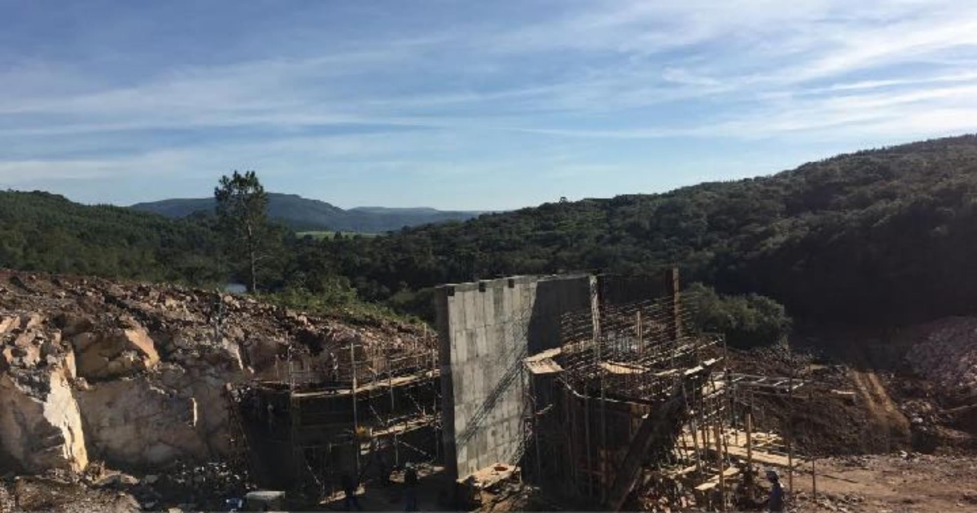
CÂMARA DE CARGA ELEVAÇÃO DAS PAREDES