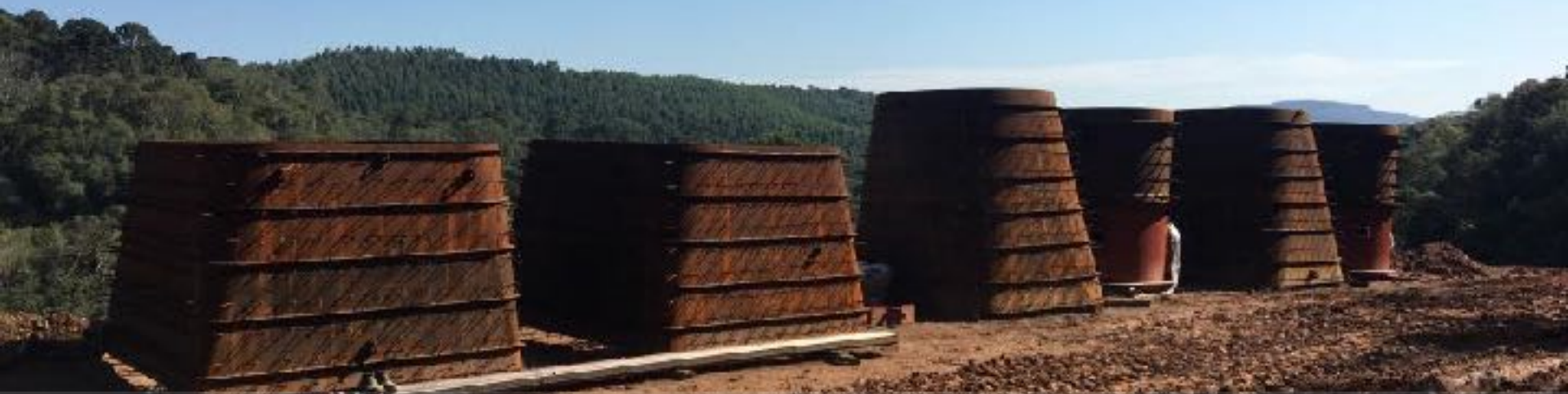
CASA DE FORÇA SUCÇÕES EM CAMPO PARA MONTAGEM