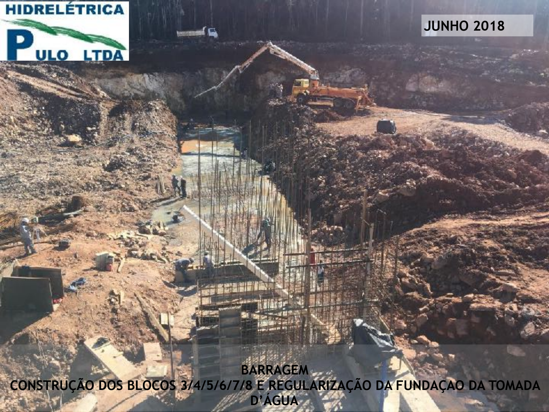
BARRAGEM CONSTRUÇÃO DOS BLOCOS 3/4/5/6/7/8 E REGULARIZAÇÃO DA FUNDAÇÃO DA TOMADA D'ÁGUA