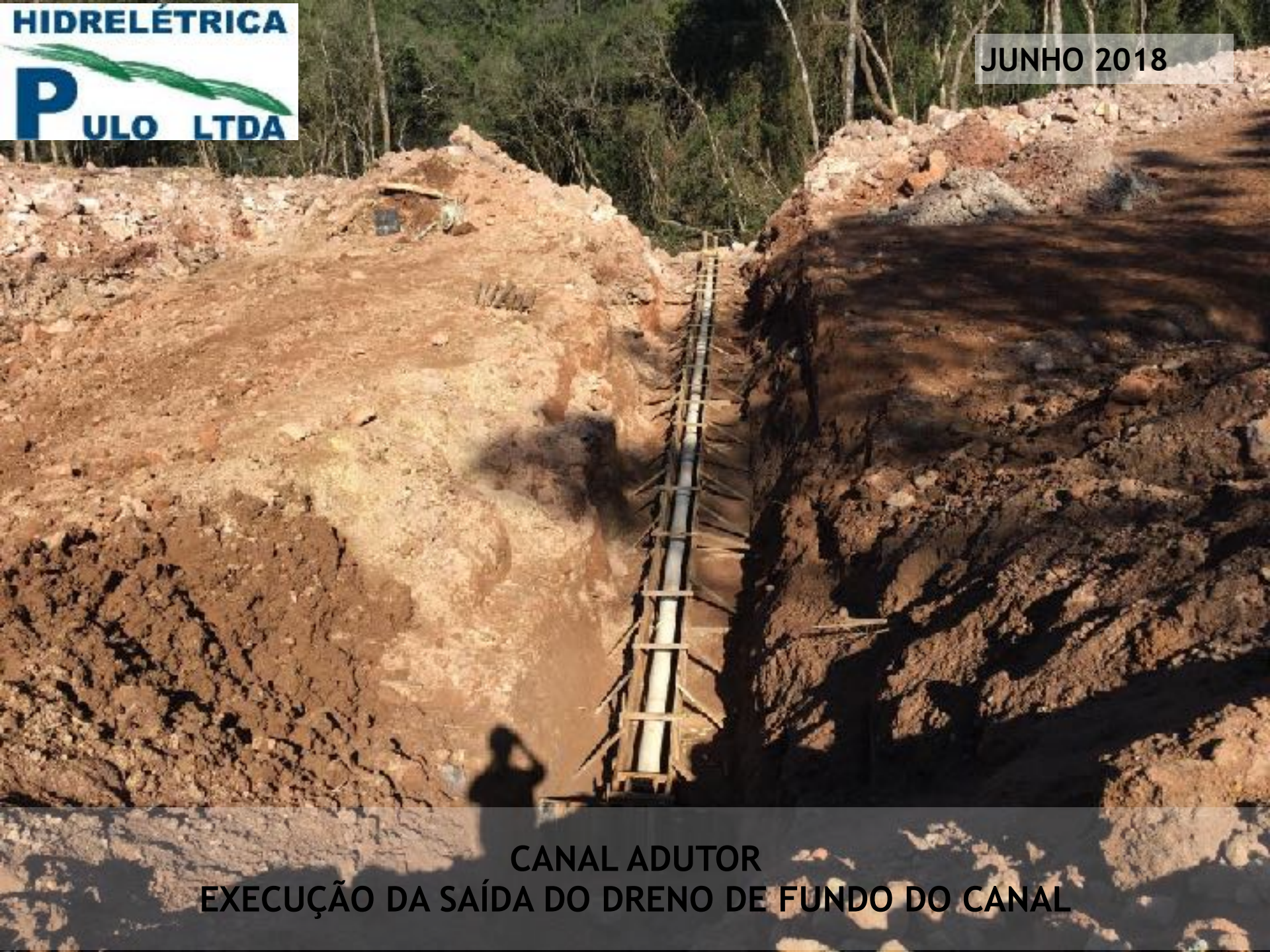
CANAL ADUTOR EXECUÇÃO DA SAÍDA DO DRENO DE FUNDO DO CANAL