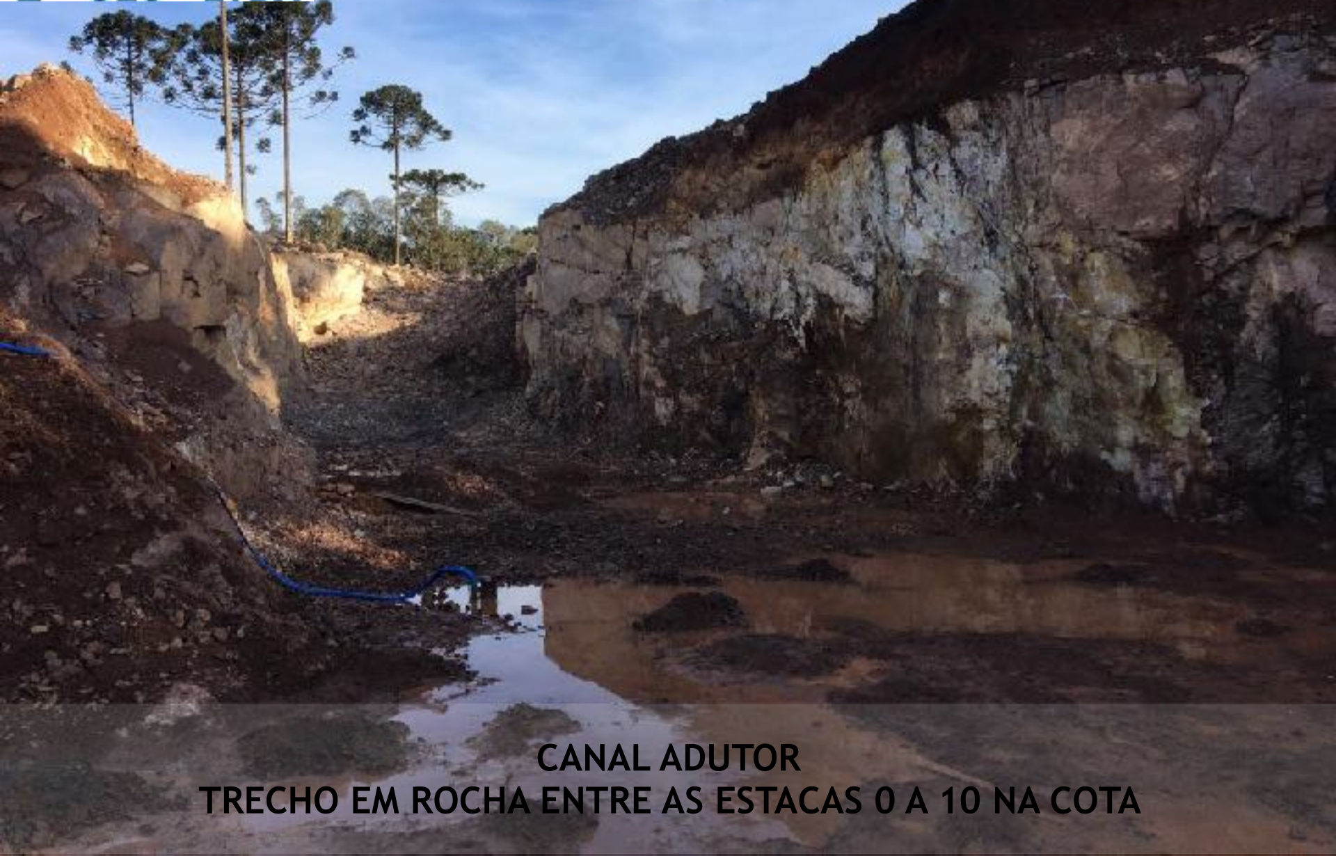
CANAL ADUTOR TRECHO EM ROCHA ENTRE AS ESTACAS 0 A 10 NA COTA