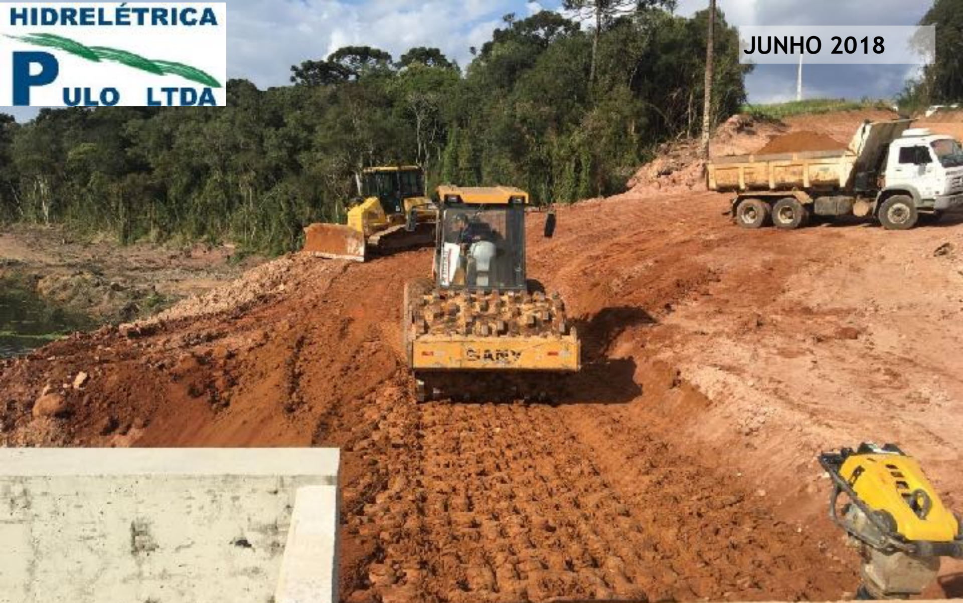
BARRAGEM ATERRO COMPACTADO NA CABECEIRA DA PONTE