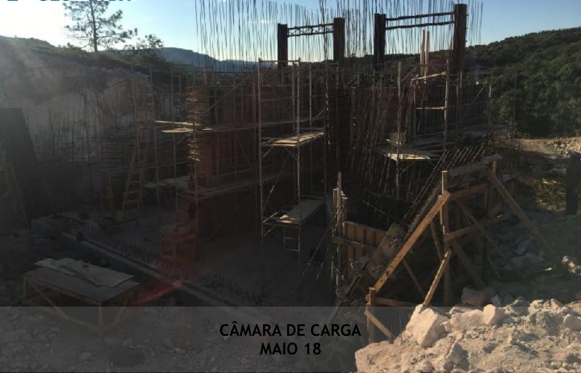
CÂMARA DE CARGA MAIO 18