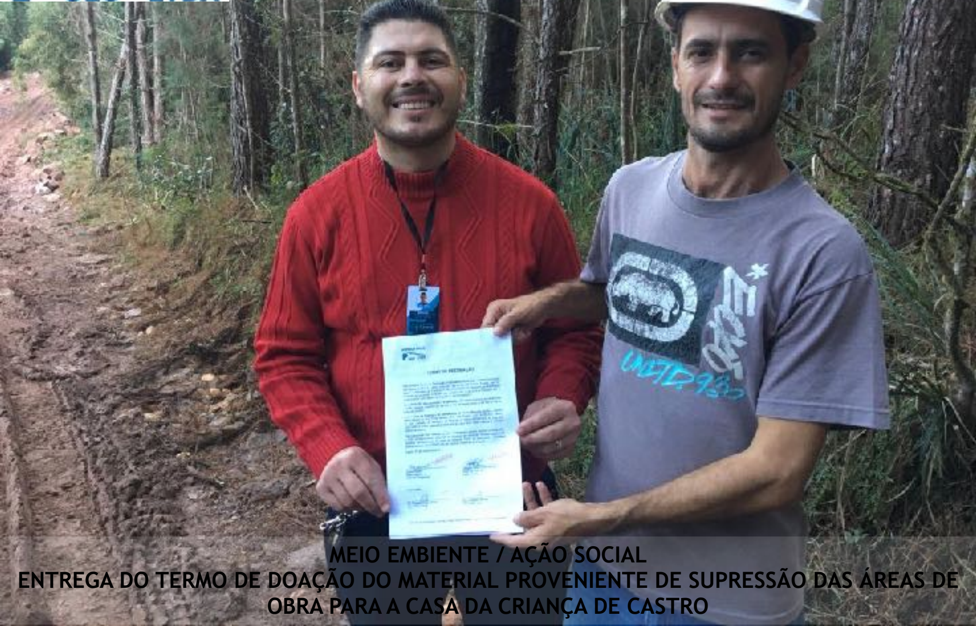
MEIO AMBIENTE / AÇÃO SOCIAL ENTREGA DO TERMO DE DOAÇÃO DO MATERIAL PROVENIENTE DE SUPRESSÃO DAS ÁREAS DE OBRA PARA A CASA DA CRIANÇA DE CASTRO