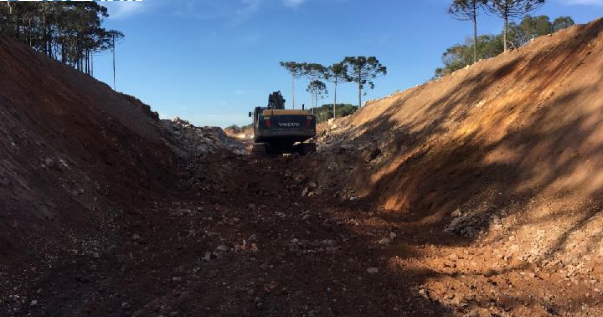
CANAL ADUTOR VISTA DAS ESCAVAÇÕES DA FASE 2 ENTRE ESTACAS 0 A 10