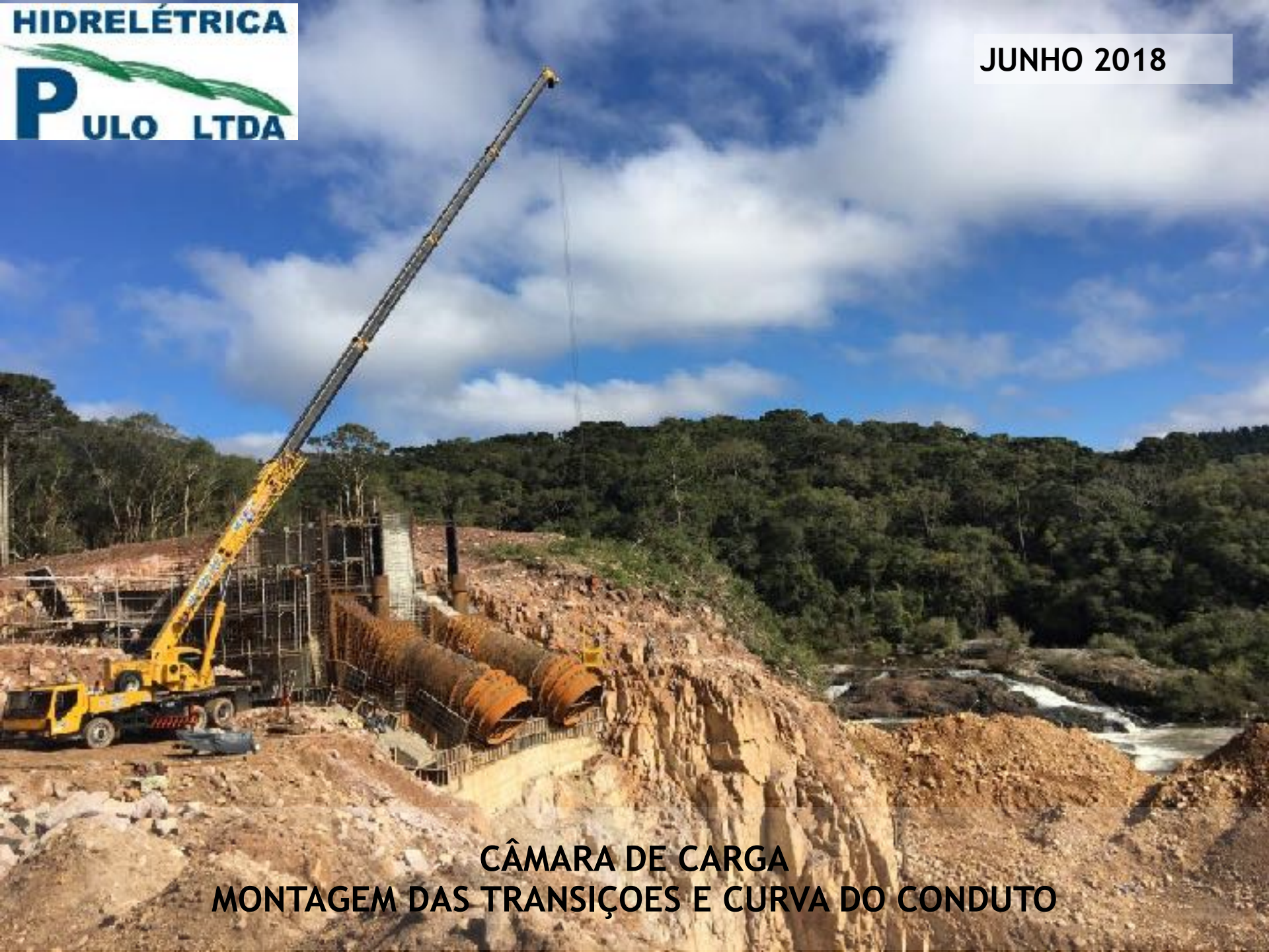
CÂMARA DE CARGA MONTAGEM DAS TRANSIÇÕES E CURVA DO CONDUTO