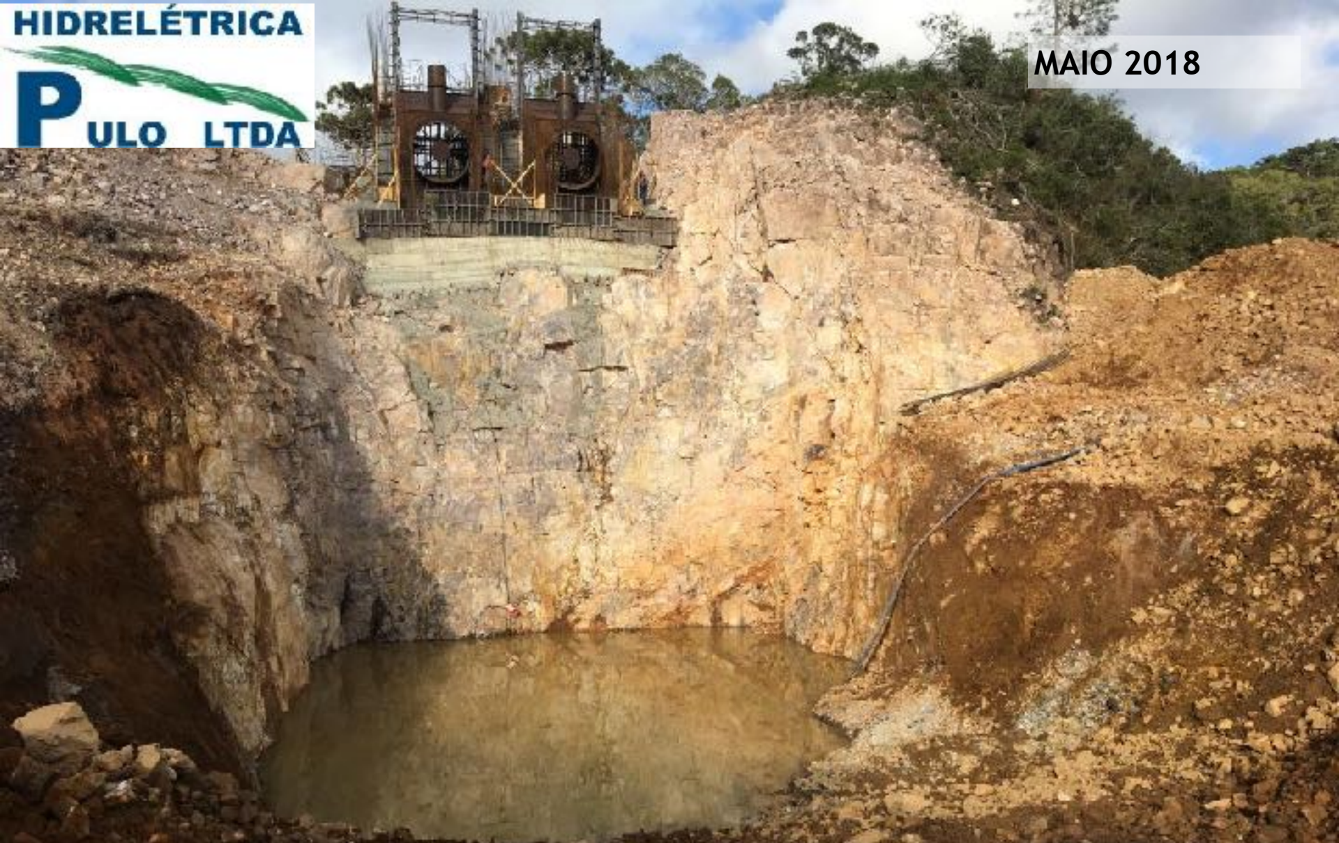
CASA DE FORÇA MAIO/18