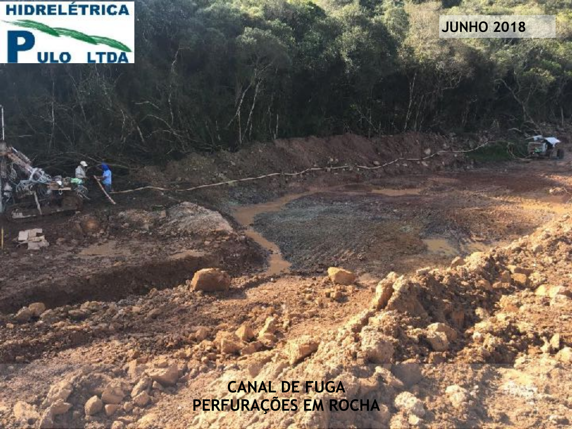
CANAL DE FUGA PERFURAÇÕES EM ROCHA