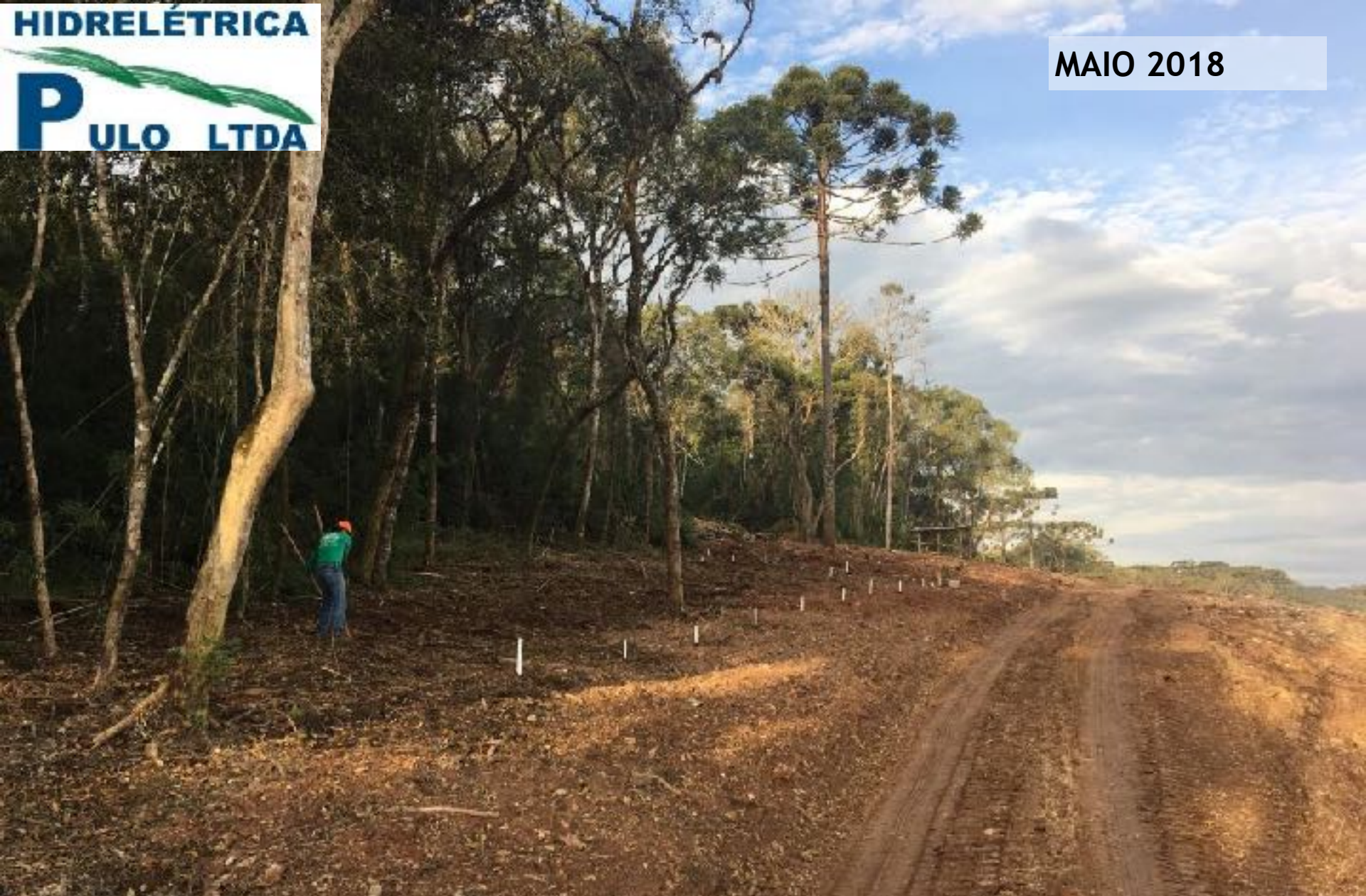
MEIO AMBIENTE PLANTIO DE MUDAS NATIVAS NAS ÁREAS DEGRADADAS NO ENTORNO DO CANAL