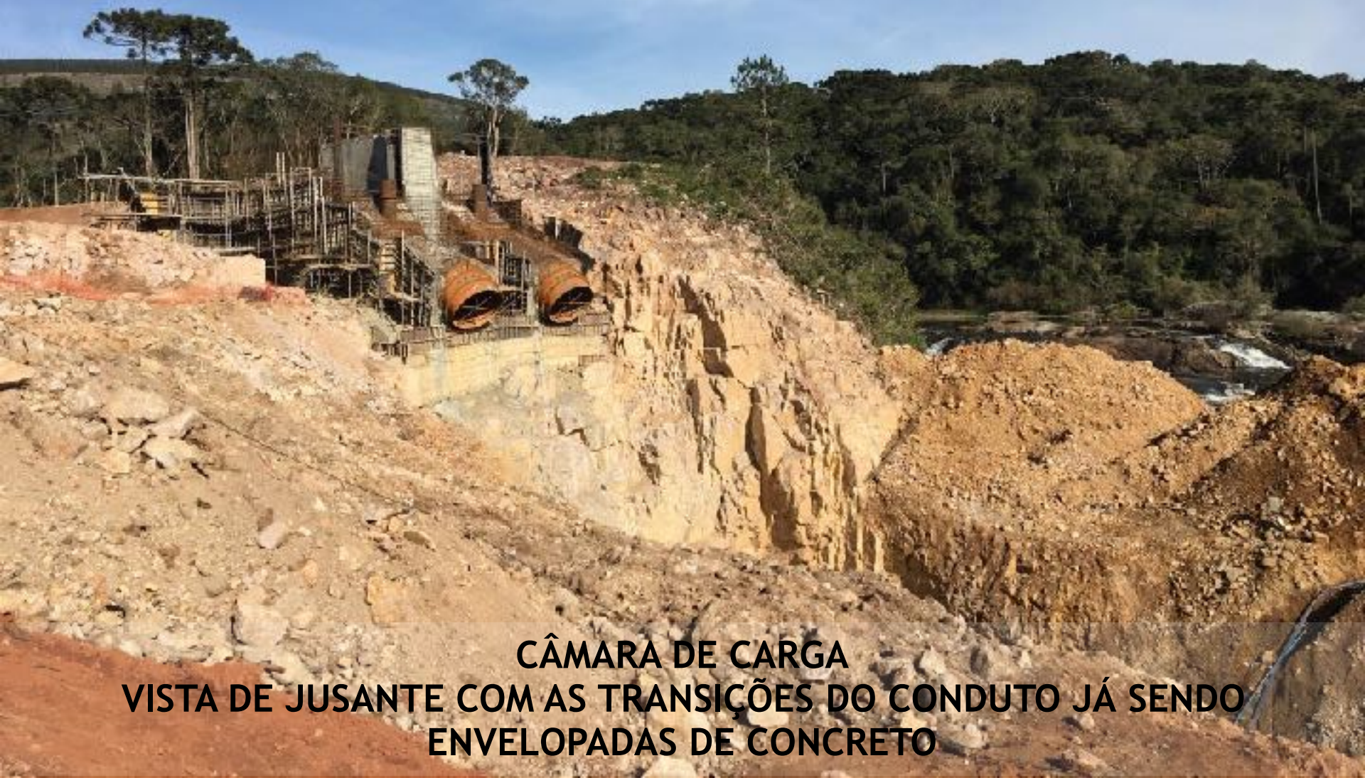
CÂMARA DE CARGA VISTA DE JUSANTE COM AS TRANSIÇÕES DO CONDUTO JÁ SENDO ENVELOPADAS DE CONCRETO