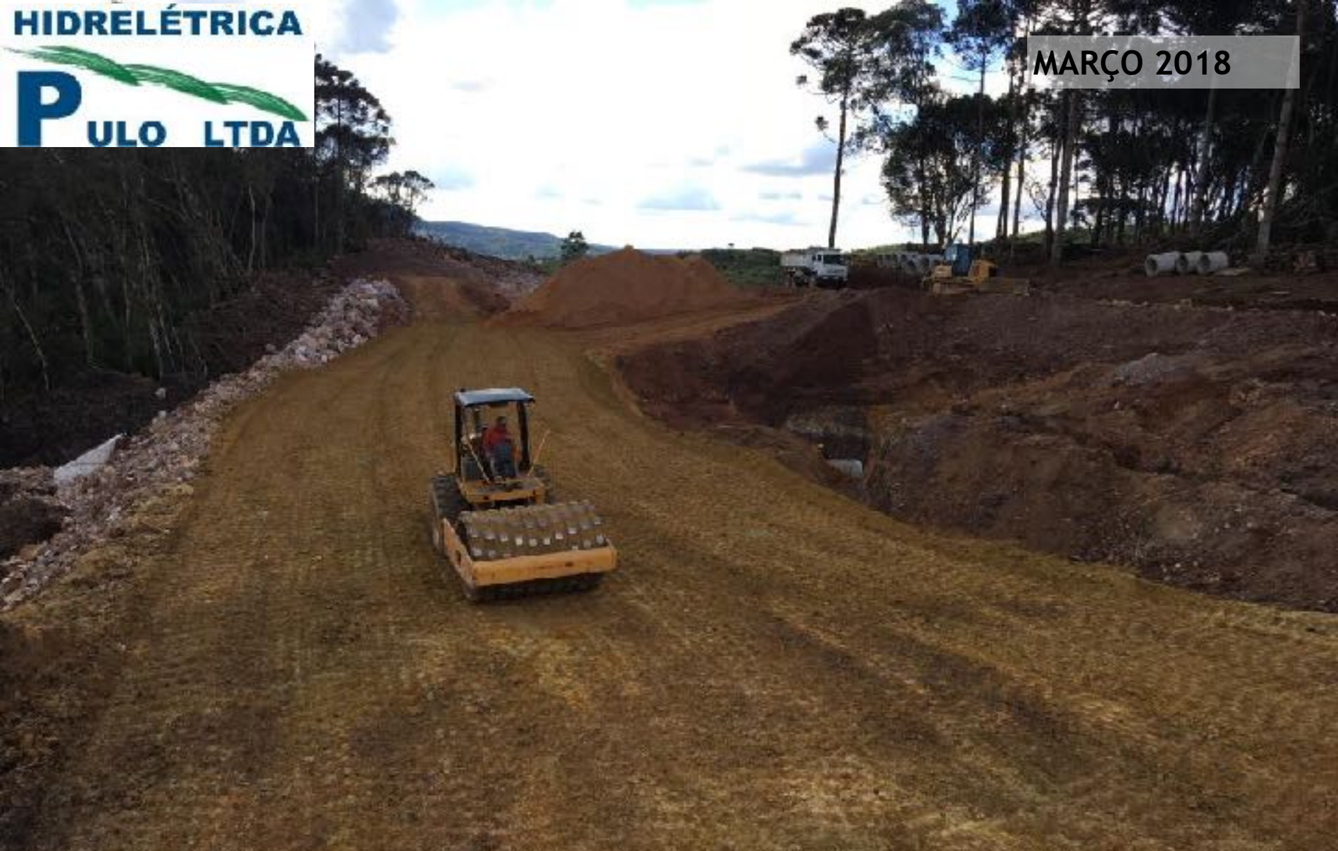
CANAL ADUTOR REATERRO CONTROLADO NO TRECHO DO BUEIRO 2