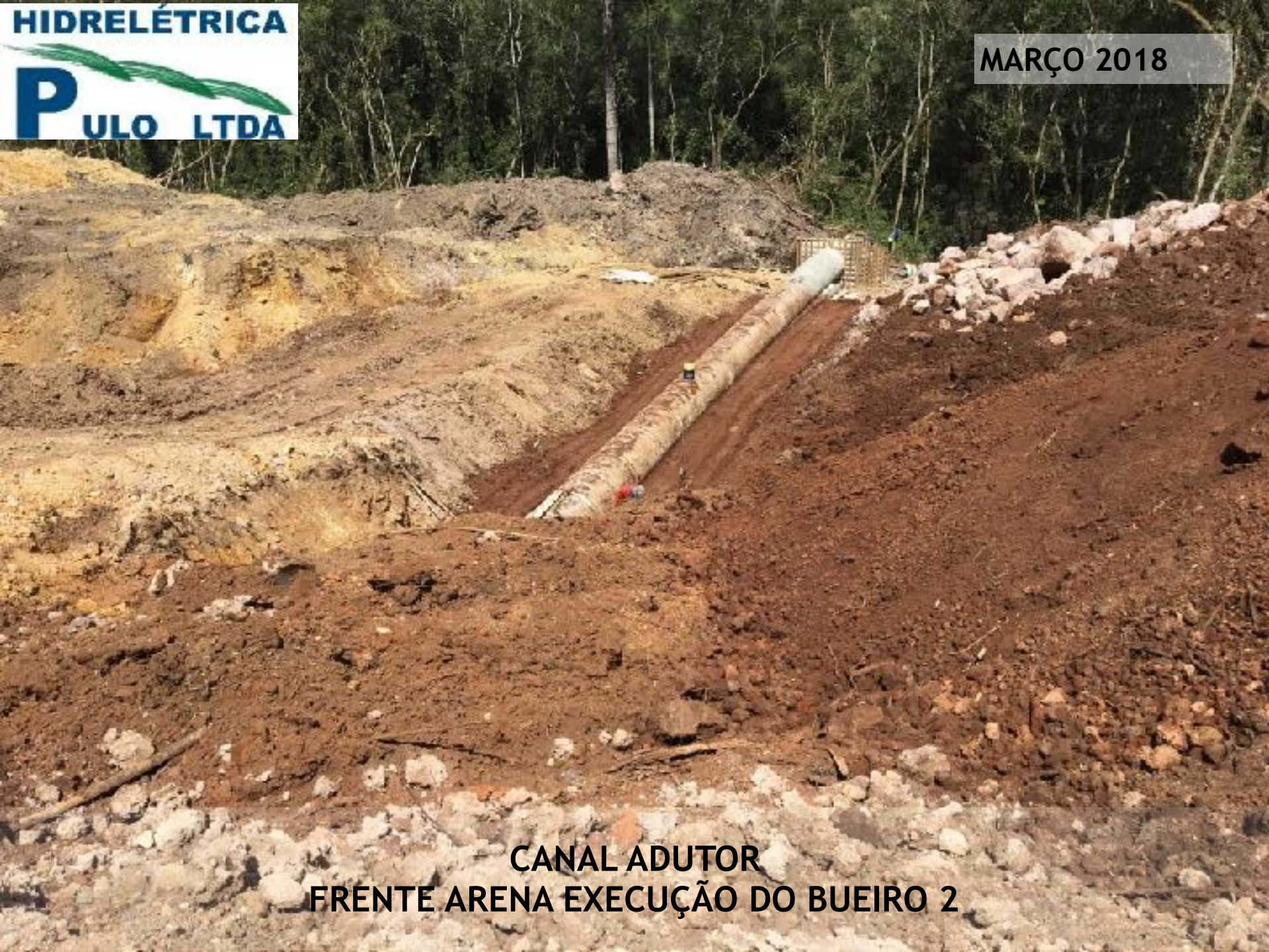
CANAL ADUTOR FRENTE ARENA EXECUÇÃO DO BUEIRO 2