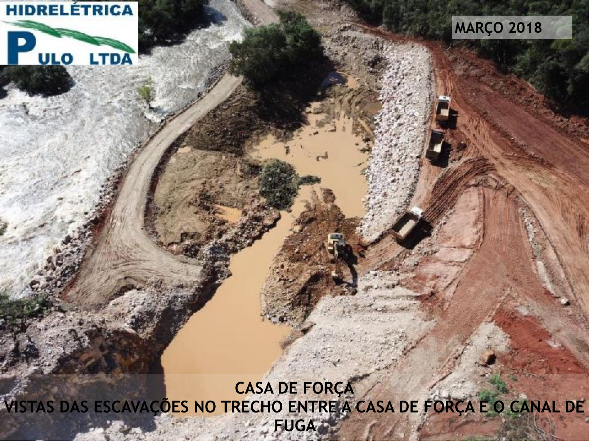
CASA DE FORÇA VISTAS DAS ESCAVAÇÕES NO TRECHO ENTRE A CASA DE FORÇA E O CANAL DE FUGA