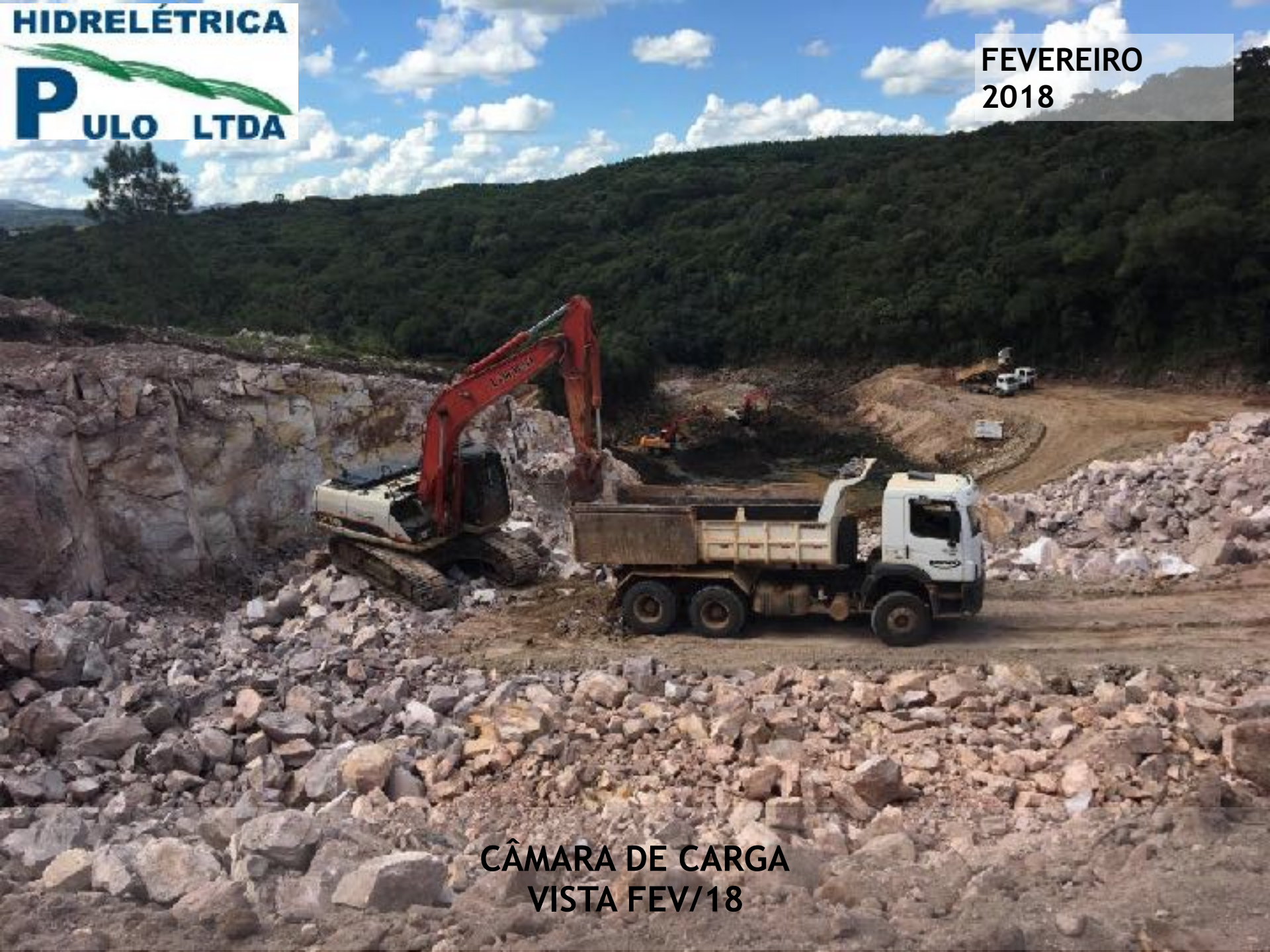
CÂMARA DE CARGA VISTA FEV/18