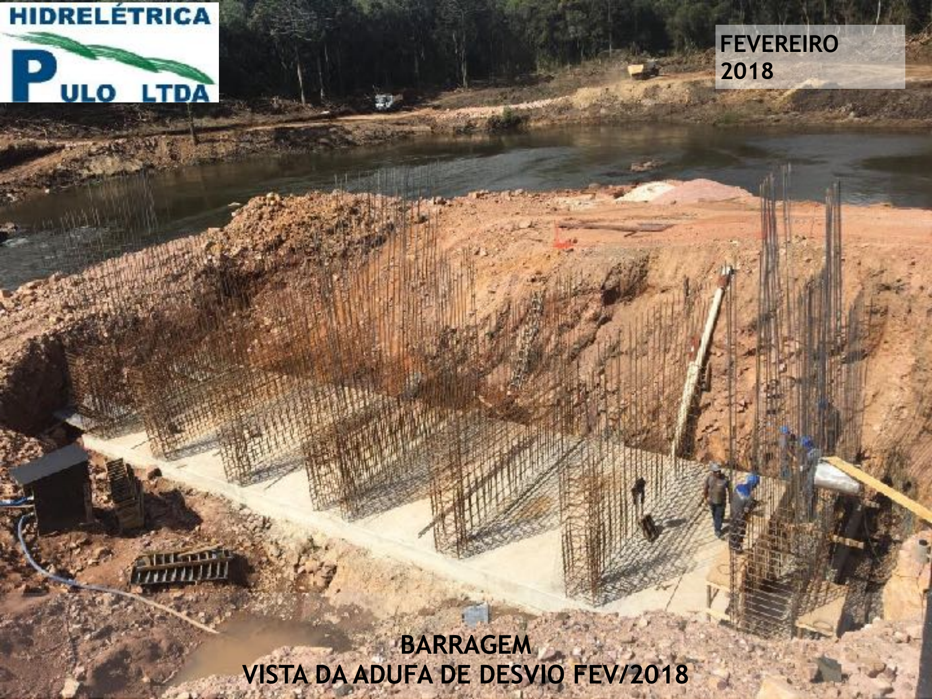
BARRAGEM VISTA DA ADUFA DE DESVIO FEV/2018