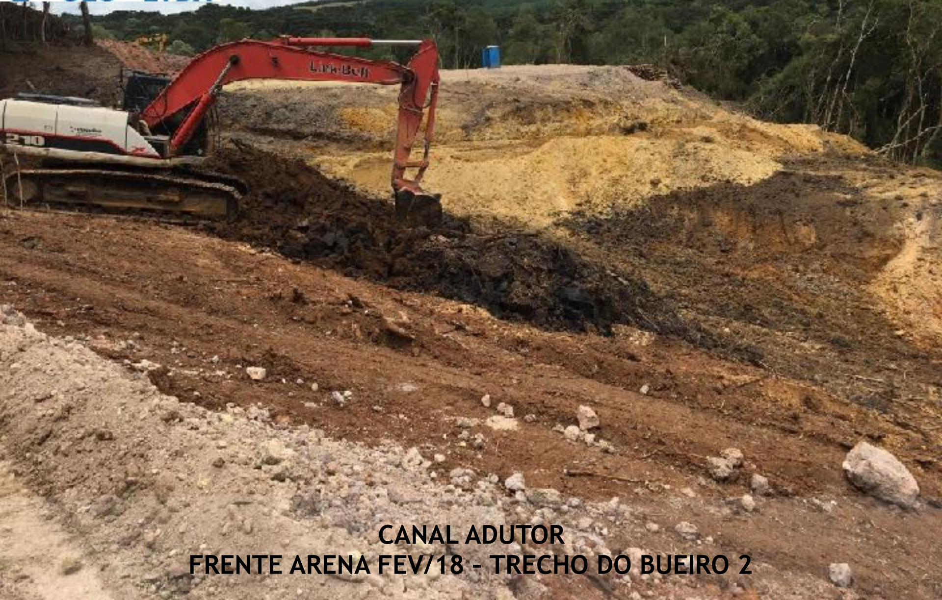
CANAL ADUTOR FRENTE ARENA FEV/18 - TRECHO DO BUEIRO 2