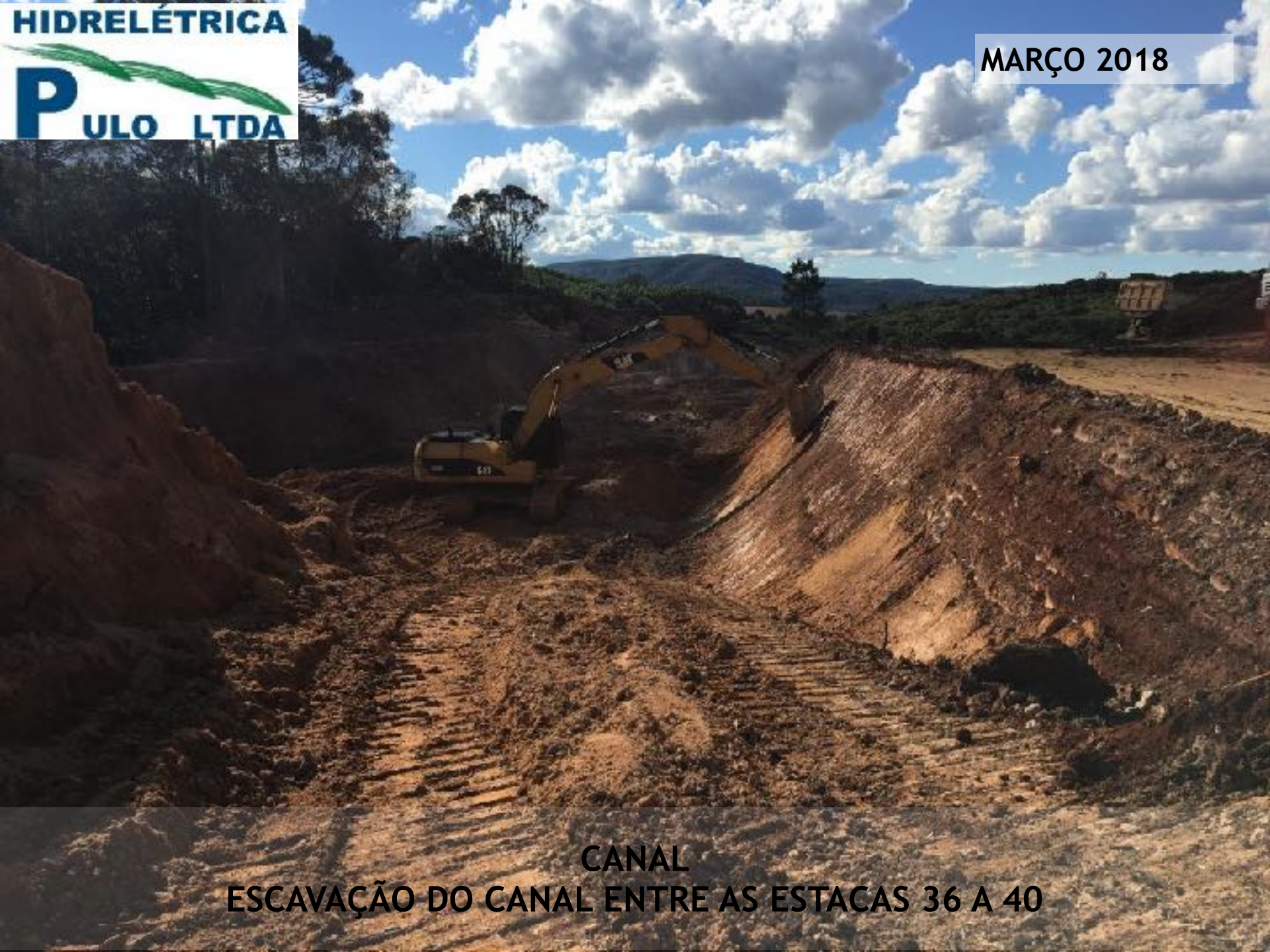
CANAL ESCAVAÇÃO DO CANAL ENTRE AS ESTACAS 36 A 40