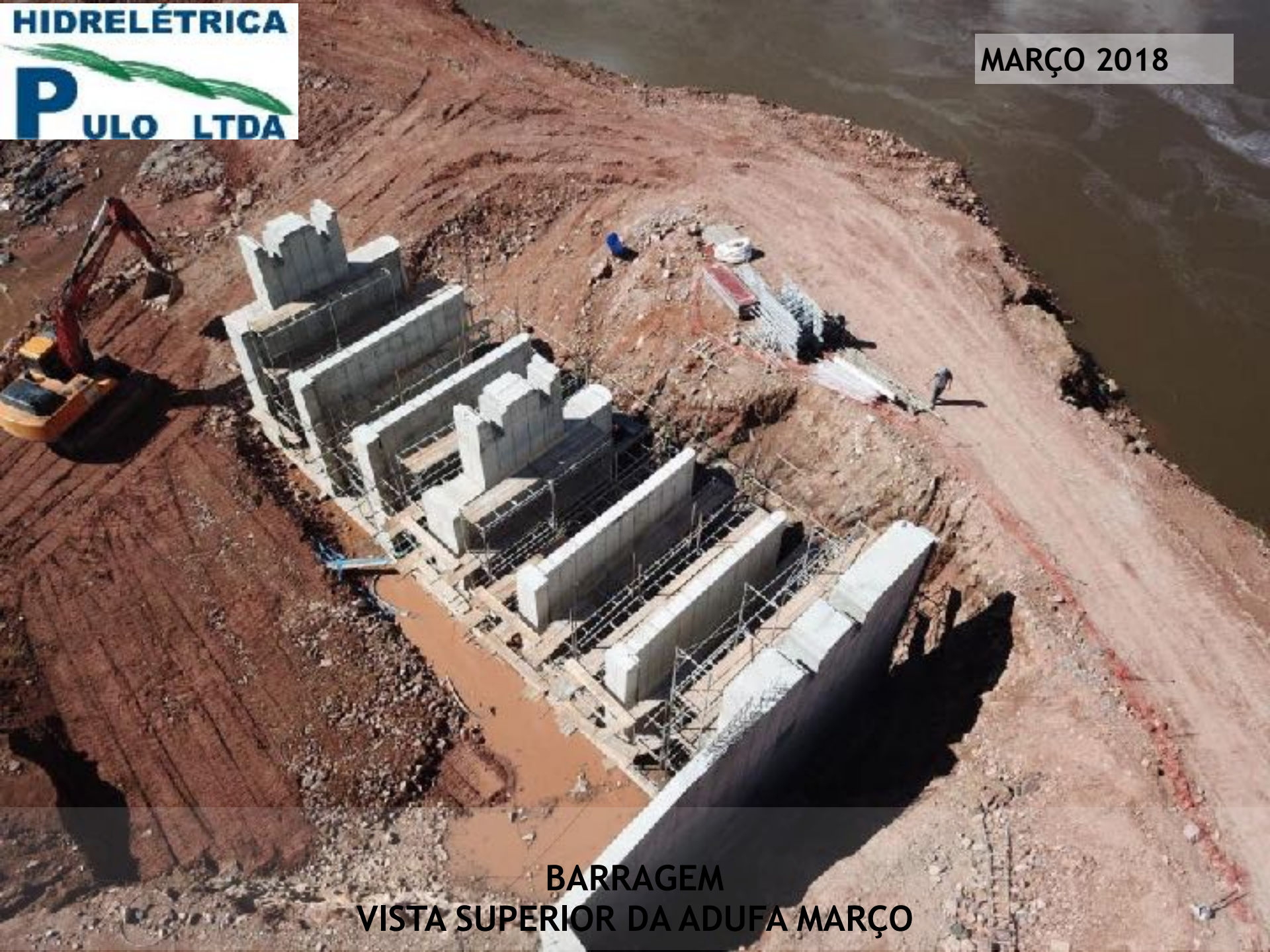
BARRAGEM VISTA SUPERIOR DA ADUFA MARÇO