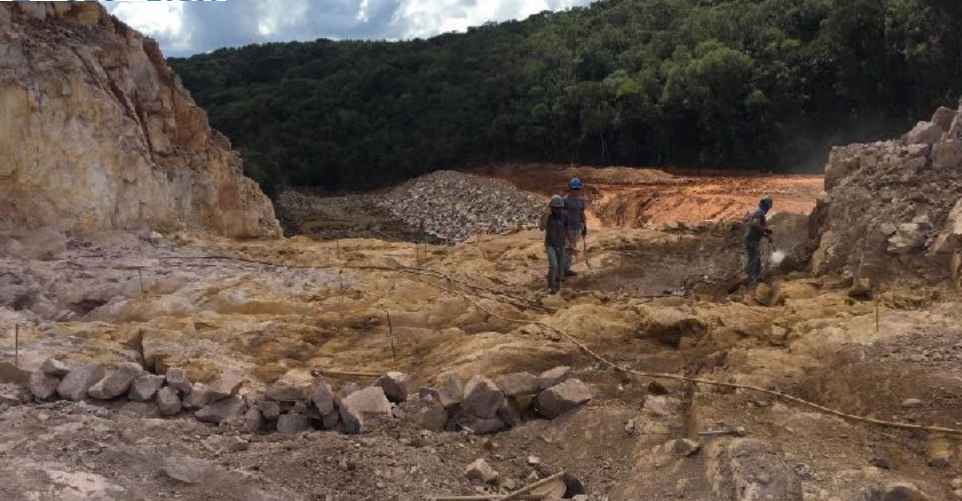
CÂMARA DE CARGA INÍCIO DA CONSTRUÇÃO CIVIL - LIMPEZA DE FUNDAÇÃO