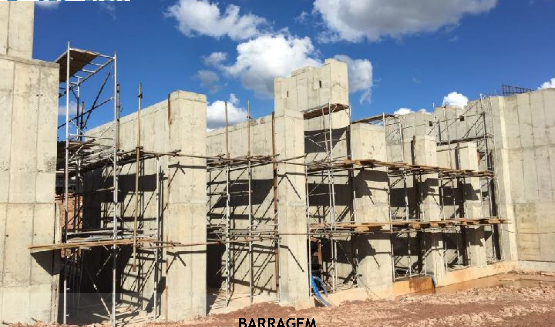
BARRAGEM ADUFA DE DESVIO EM FASE DE ACABAMENTOS